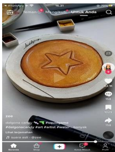
Gambar 2. Konten TikTok @azizahaghiya

“Jadi dari TikTok aku nemu banyak teman-teman online, malah orang-orang di real life baru tau kalau aku aktif di TikTok, jadi kalau mereka ketemu di fyp baru deh mereka follow, selain itu TikTok juga ngebantu aku banget untuk tau hal-hal yang terjadi di masyarakat, aku jadi tau ternyata disana tuh ada begini ya, atau yang lagi viral-viral biasanya di TikTok duluan tuh, jadinya aku tau, terus tuh juga kadang kalau ada yang viral aku filterisasi dulu, yang bagus nya gimana, kalau misalnya ini cocok untuk konten aku, aku masukin gitu, aku kombinasikan sama konten menggambar aku, contoh nya waktu rame-rame nya tentang squid game, nah disitu aku buat konten terkait squid game, disitu aku ngegambar dalgona candy.” (Wawancara, 04 April 2023).