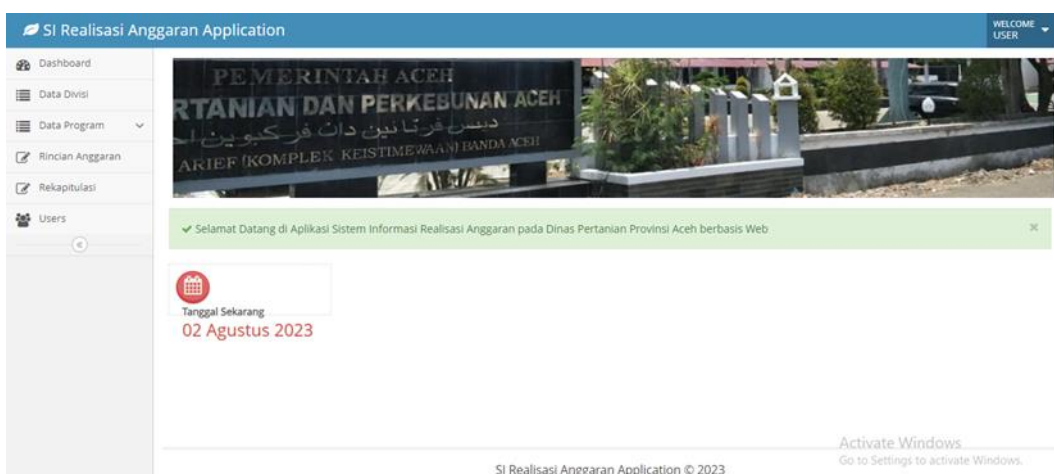
Gambar 3. Tampilan Halaman Dashboard

Setelah perancangan, dilakukan implementasi aplikasi berdasarkan rancangan yang telah dibuat sebelumnya. Antarmuka pengguna dikembangkan dengan tata letak yang jelas dan intuitif, menggunakan elemen grafis untuk memudahkan pengguna. Aplikasi ini juga responsif, sehingga dapat diakses dari berbagai perangkat dengan nyaman. Aplikasi ini telah diuji secara menyeluruh untuk memastikan fungsionalitas yang baik, kinerja yang responsif, dan keamanan yang memadai. Pengujian meliputi uji fungsionalitas, kinerja, dan keamanan. Selain itu, pemeliharaan aplikasi juga dilakukan secara berkala untuk memperbaiki bug dan memastikan bahwa aplikasi tetap berjalan dengan baik. Dengan pengembangan ini, diharapkan Kantor Dinas Pertanian Provinsi Aceh dapat memanfaatkan aplikasi ini untuk memantau dan mengelola informasi mengenai realisasi anggaran dengan lebih efektif dan efisien. Aplikasi ini diharapkan dapat memberikan manfaat dalam pengambilan keputusan, pelaporan, dan visualisasi data yang lebih mudah dipahami, sehingga membantu meningkatkan efisiensi dalam pengelolaan anggaran dan memperkuat pengambilan keputusan di pada anggaran. Aplikasi ini menyediakan beberapa menu utama yang mencakup fitur-fitur penting seperti Dashboard untuk gambaran umum, Data Divisi untuk informasi tentang divisi-