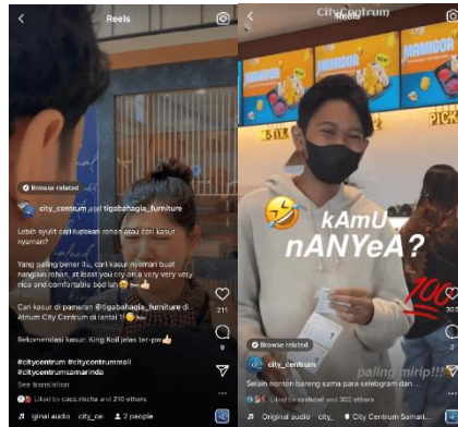
Gambar 3. Sedang Trending