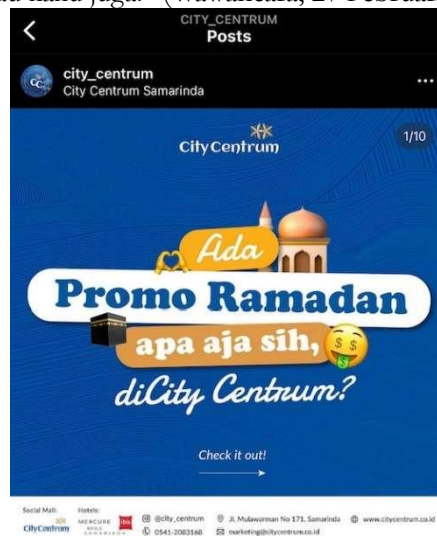
Gambar 1. Brand's Guideline : Warna putih, biru dan emas

“Kalo untuk template story dan feeds tentunya mengikuti brand's guideline yaitu harus warna putih, biru dan emas. Kalo template Erica yang bikin dan sudah design semuanya jadi aku tinggal ngikutin aja, misal untuk thumbnailsnya reels aku tinggal tambahkan logo city centrum aja diatas, kalo untuk template yang lain engga karena gak mau kaku juga.” (Wawancara, 27 Februari 2023).