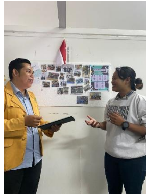
Gambar 7. Wawancara dengan Exca Sukas Jody

“Lupa episode berapa karena saya nontonnya acak, namun pertama kali saya menonton yaitu ketika bintang tamunya adalah nenek Arpah yang ditipu tetangganya, dengan topik rupa-rupa problema hukum masyarakat Indonesia”.