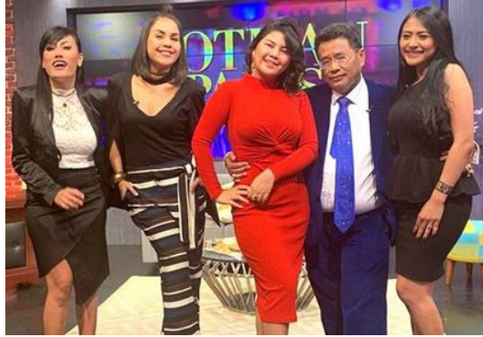
Gambar 10. Bintang tamu dan Co host Hotman Paris Show

“setelah beberapa kali menonton Hotman Paris Show.. ko saya jadi kurang respect ya, apalagi liat co-host yang sensasional, heboh dan seksi hahaha..... termasuk bagaimana cara bertanya dari Bang Hotman yang sangat terbuka, privasi dan vulgar”. (Mei 2023).