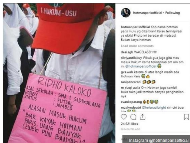
Gambar 1. Persepsi Mahasiswa Baru Fakultas Hukum

Dampak sosok Hotman Paris tergambar dalam motivasi yang menimbulkan persepsi pada bagi mahasiswa Fakultas Hukum. Salah satunya yang sempat viral adalah persepsi mahasiswa baru di Universitas Sumater Utara Medan karena melihat program Hotman Paris Show menjadi salah satu alasan masuk Fakultas Hukum seperti yang dipublikasi dalam media sosial @hotmanparisofficial yang digambarkan pada gambar di bawah ini.