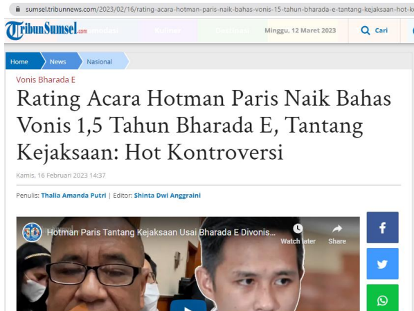
Gambar 1. Rating Hotman Paris Show

Hutapea. Selain itu, sebagai bagian dari program acara ini, seorang Hotman Paris Hutapea juga menawarkan nasihat hukum, rekomendasi, dan langkah-langkah untuk memecahkan masalah [11].