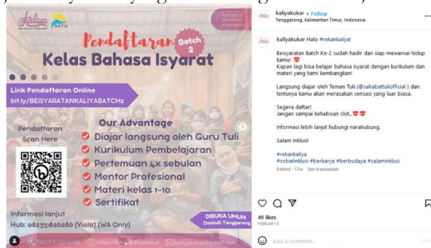
Gambar 6. Informasi Pendaftaran Kelas Beisyaratan

Menurut bentuk isi pesannya ialah persuasif diberikan oleh Komunitas Kaliya berupa ajakan kepada masyarakat untuk menjadi masyarakat yang inklusi dengan cara belajar bahasa isyarat.