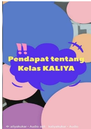
Gambar 8. Testimoni Kelas Beisyratan

Salah satu postingan yang bertujuan untuk mengedukasi khalayak atau masyarakat yang dilakukan Komunitas Kutai Literasi dan Budaya Etam untuk membangun kesadaran masyarakat dalam belajar bahasa isyarat yang bertujuan untuk meyakinkan Postingan reels instagram tentang undang-undang disabilitas tentang Hak Penyandang Disabilitas pada Instagram Komunitas Kutai Literasi dan Budaya Etam. Undang-Undang tentang perlindungan dan pemenuhan hak penyandang disabilitas Peraturan Daerah Kalimantan Timur.