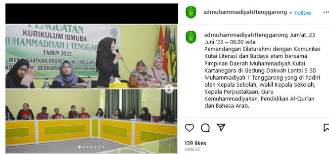
Gambar 9. Sosialisasi Kaliya ke Sekolah

Komunitas Kutai Literasi dan Budaya Etam dalam aktivitas komunikasinya untuk membangun kesadaran masyarakat belajar bahasa isyarat melakukan secara komunikasi langsung dan tidak langsung. Komunikasi langsung merupakan komunikasi yang dilakukan dengan bertemu langsung komunikasi dan komunikator, komunikasi langsung dilakukan dengan tatap muka. Komunikasi secara langsung yang dilakukan Komunitas Kutai Literasi dan Budaya Etam pada awalnya mereka melakukan pengenalan di area Car Free Day yang dilaksanakan setiap hari minggu di Jalan M. Yamin, Tenggarong, Kalimantan Timur. Kemudian mereka mengadakan program Kaliya Goes to School yaitu merupakan program kunjungan Komunitas Kutai Literasi dan Budaya Etam ke sekolah-sekolah yang berada di Kutai Kartanegara untuk memperkenalkan bahasa isyarat kepada anak-anak usia sekolah.