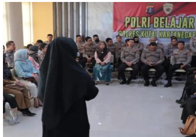
Gambar 10. Kunjungan ke Polres Kukar

Sosialisasi bahasa isyarat kepada anak-anak Sekolah Dasar Pesan untuk mereka kepedulian mereka dibangun sejak usia dini lewat edukasi mengenai bahasa isyarat dan juga diinformasikan mengenai keberadaan tunarungu atau teman tuli didunia ini yang berkomunikasi menggunakan bahasa isyarat. Komunitas Kutai Literasi dan Budaya Etam juga melakukan aktivitas komunikasinya dengan sosialisasi dan berkolaborasi dilingkungan pemerintah dan lembaga penegak hukum yaitu kepolisian yang berada di Kutai Kartanegara.