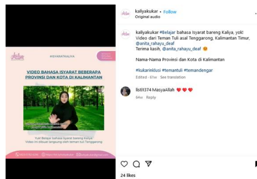
Gambar 3. Reels Tokoh Tuli memperkenalkan Bahasa Isyarat

Langkah awal dari perumusan strategi tidak terlepas dari menentukan khalayak atau mengenali khalayak dalam usaha komunikasi yang efektif, khalayak disini adalah pihak yang menjadi sasaran pesan yang dikirim komunikator. Komunikator dalam hal ini adalah Komunitas Kutai Literasi dan Budaya Etam yaitu Anggota, volunteer serta tunarungu atau teman tuli yang turut ikut membantu membangun kesadaran masyarakat dalam belajar bahasa isyarat.