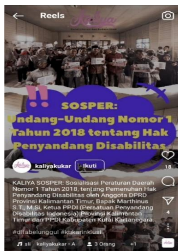
Gambar 7. Postingan UU Disabilitas

Edukatif ialah pesan juga turut disampaikan oleh Komunitas Kutai Literasi dan Budaya Etam dengan cara mengedukasi mengenai seputar bahasa isyarat dan tunarungu atau teman tuli, edulasi mengenai perspektif terkait disabilitas dan bagaimana cara pendampingan disabilitas.