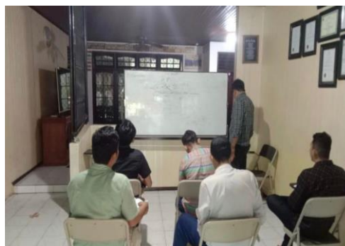
Gambar 4. Kegiatan Seminar di Yayasan Sekata