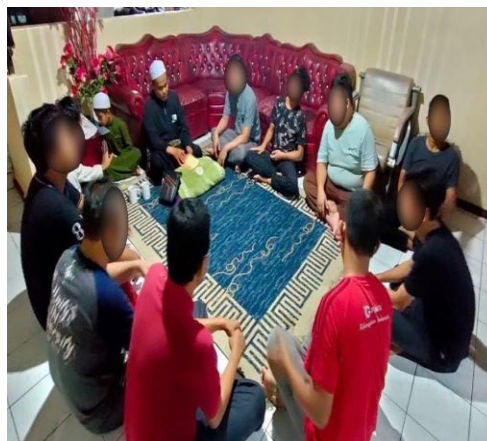
Gambar 3. Kegiatan Keagamaan di Yayasan Sekata

“Menurut saya kegiatan disini kita diajarkan untuk mengisi schedule-schedule kita misalnya dari pagi kita bangun ada kegiatan yang namanya morning meeting, kegiatan keagamaan dan juga ada seminar-seminar, sehingga keseharian kita tidak kosong dan terasa lebih positif”.