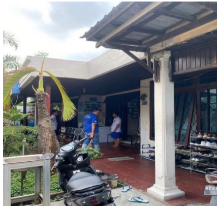
Gambar 2. Lingkungan di Yayasan Sekata

Berdasarkan penjelasan, bahwa perilaku residen dapat dirubah dengan mengubah pola pikir dan mindset yang didukung oleh faktor lingkungan dengan melakukan sebuah kegiatan-kegiatan positif. Sebagaimana yang diungkapkan oleh Residen di Yayasan Sekata yaitu Saudara Riyan Fahrizal, yaitu: