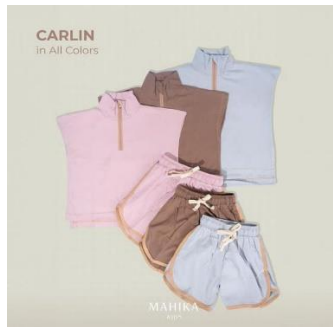
Gambar 5. Sumber: Instagram @mahikakids