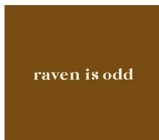
Gambar 7.