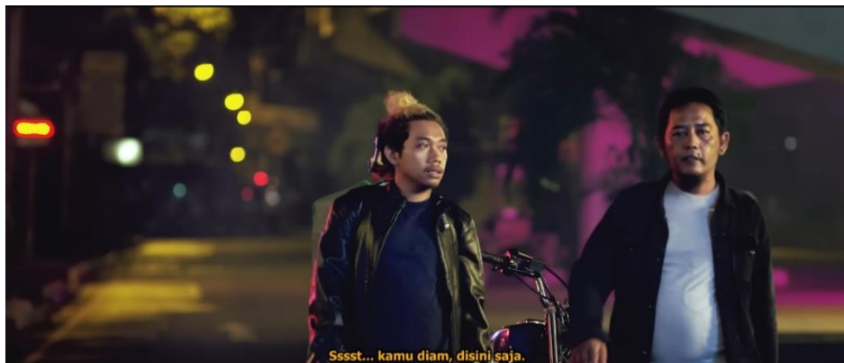
Gambar 3. Film Pendek Loz Jogjakartoz

Menurut (Pradipta & Suardana, 2017), tindakan premanisme umumnya dilakukan dengan cara memaksa dan memeras hingga melakukan ancaman dengan kekerasan fisik maupun psikis.