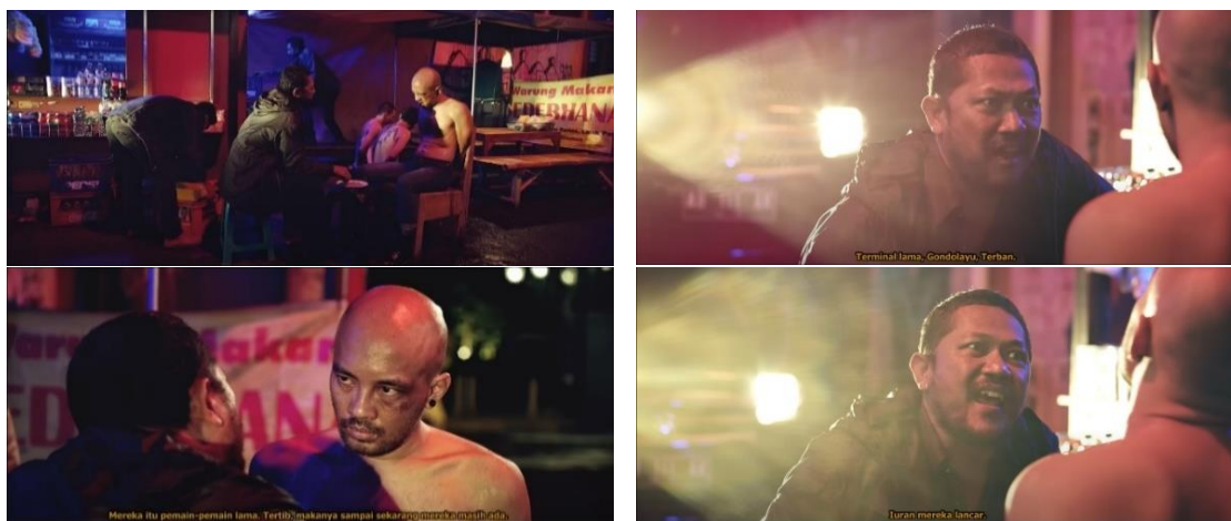
Gambar 5. Film Pendek Loz Jogjakartoz

Menurut (Mulyanto, 2017), sarkasme merupakan sebuah gaya bahasa penghinaan yang mengekspresikan rasa kesal dan dimaksudkan untuk menyinggung atau menyindir seseorang. Seperti yang diketahui bersama, bayi merupakan sebutan untuk seseorang yang baru atau belum lama lahir dan tentunya belum bisa berbuat banyak. Lontaran kata ‘bayi’ tersebut membuat Artos dan kedua temannya marah hingga pada akhirnya menyerang Bendol menggunakan pisau hingga terluka parah. Mitos (Gambar 4): Tindakan kriminal seperti penganiayaan hingga penusukan biasanya dilakukan oleh seorang preman. Preman cukup identik dengan penggunaan senjata tajam seperti pisau, pedang, dan sebagainya. Menurut (Munthe et al. , 2023), preman memiliki senjata, bahkan digunakan untuk menunjukkan kekuatannya guna mengintimidasi, membuat takut, bahkan untuk menyakiti sasarannya.