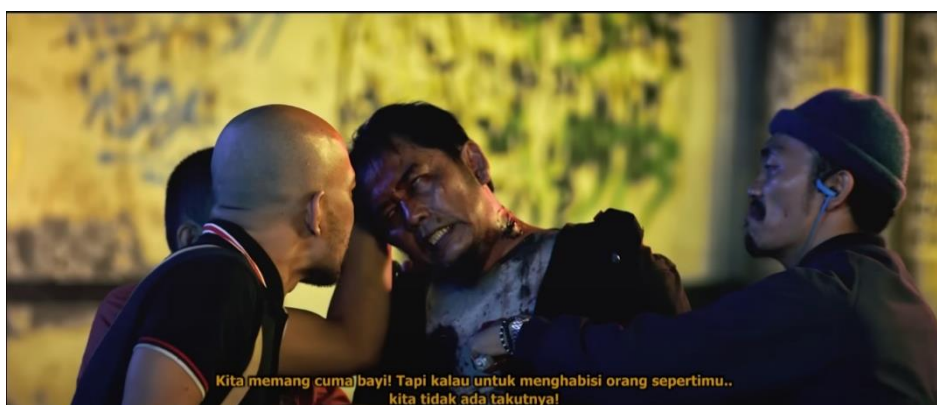
Gambar 4. Film Pendek Loz Jogjakartoz