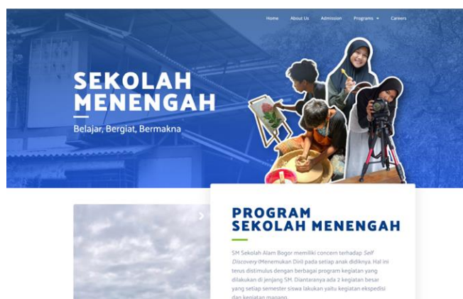
Gambar 1. Tampilan Situs SM Sekolah Alam Bogor

Salah satu sekolah yang menerapkan pembelajaran, bahkan dijadikan sebuah kurikulum belajar adalah Sekolah Alam Bogor. Suatu pendidikan dapat dikatakan berkualitas ialah adanya kurikulum yang relevan, yaitu kurikulum harus dirancang agar dapat menyesuaikan dengan kebutuhan dan perkembangan siswa, mencakup pembelajaran yang relevan dengan dunia nyata dan beradaptasi dengan perubahan zaman (Kwok, 2022). Nyawa dari suatu pendidikan itu terletak pada kurikulum yang diterapkan (Miladiah et al. , 2023). Sekolah Alam Bogor mengintegrasikan empat pilar kurikulum, yaitu pilar akhlak, pilar logika berfikir, pilar kepemimpinan dan pilar bisnis. Dikutip langsung dari situs resmi Sekolah Alam Bogor, pilar kepemimpinan memberikan pembelajaran kepada siswa tentang bagaimana manusia bisa menjadi pemimpin di bumi. Hal ini didorong dengan adanya berbagai program kegiatan yang diberikan pada jenjang SM (Sekolah Menengah), dimana mereka memiliki concern terhadap self discovery . Dua kegiatan besar yang dilakukan pada setiap semesternya adalah kegiatan ekspedisi dan magang.