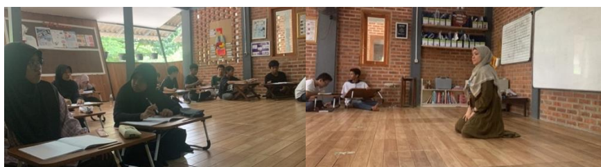
Gambar 5. Kegiatan Pembelajaran Matematika SM 2

Dalam situasi belajar mengajar maka reaksi atau tanggapan yang ditunjukkan oleh siswa berupa konfirmasi kata-kata atau kalimat menjawab, tindakan menjalani arahan guru ataupun bahasa tubuh seperti mengangguk akan pemahaman terhadap materi, merupakan unsur yang penting dalam proses belajar yaitu reaksi positif dari siswa (Lestari et al. , 2019). Di SM Sekolah Alam Bogor, pola komunikasi sirkuler banyak terjadi dan diberikan kesempatan oleh para guru. Hal ini diketahui ketika Pak Indra dan Pak Arief menyatakan bahwa mereka selalu memberikan kesempatan agar siswa-siswi dapat bertanya, berdiskusi dan bernegosiasi terlebih dahulu terkait hal yang kurang jelas dan selalu ada timbal balik dari siswa. Hal ini juga menjadi cara bagaimana guru memberikan kesempatan membuat komunikasi yang fasilitatif. Informan ahli menyatakan bahwa guru harus dapat berperan dalam membangkitkan komunikasi yang fasilitatif untuk menstimulus siswa dalam berpikir secara kompleks, menganalisis, identifikasi masalah hingga mencari solusi. Selain itu juga menstimulus sifat Tabligh yaitu artinya penyampai, kemampuan berkomunikasi dalam menyampaikan kebenaran dan berani bersikap transparansi, dan terbuka (Jahari & Rusdiana, 2020:70). Komunikasi efektif yang memotivasi orang lain, simpati, memahami dan mendukung dapat mempengaruhi citra diri orang dan membangun hubungan interpersonal (Hastasari et al. , 2022).