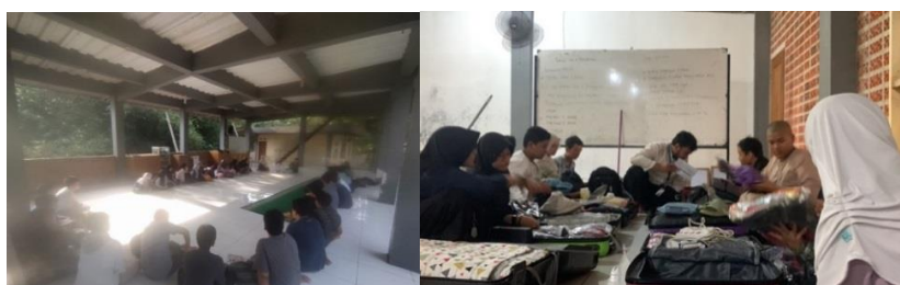
Gambar 2. Pesan Verbal dan Nonverbal dalam Evaluasi dan Persiapan Kegiatan

Dalam proses komunikasi yang telah dianalisa, guru SM Sekolah Alam Bogor diusahakan selalu menerapkan sikap kepemimpinan baik dalam berkomunikasi menggunakan lambang verbal maupun nonverbal. Pola komunikasi primer yang menggunakan lambang verbal, terjadi ketika guru secara langsung berkomunikasi, menyampaikan materi dan tanya jawab dengan siswa baik menggunakan bahasa yang formal atau semi formal, tergantung dengan situasi dan kondisi. Dalam penerapan sikap kepemimpinan, guru akan menyampaikan pesan terkait peringatan, evaluasi, apa yang sudah dikerjakan, kekurangannya apa, yang sudah berjalan, dan apa yang perlu dievaluasi.