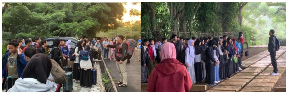
Gambar 4. Pemberian Instruksi oleh Guru Kepada Siswa

Spirit, dimana ada guru yang memberi motivasi, semangat dan informasi-informasi untuk seminggu kedepan. Sedangkan ketika dalam kegiatan alam terbuka, siswa-siswi diinstruksikan untuk membawa barang-barang yang sudah dibuatkan oleh guru, pemberian tugas ketika dalam perjalanan dan ketika situasi darurat dimana perintah guru sangat krusial dan membutuhkan kedisiplinan siswa.