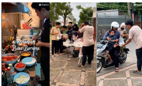
Gambar 6. Jumat Berbagi Berkah Bersama Bhamasatya