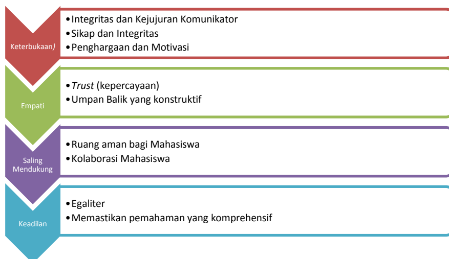
Gambar 2. Kesalingan Dosen dan Mahasiswa

Peneliti melihat bahwa kelebihan penggunaan komunikasi interpersonal tersebut tidak lepas dari sikap kesalingan antara dosen dan mahasiswa yang akan dijelaskan sebagaimana berikut ini: