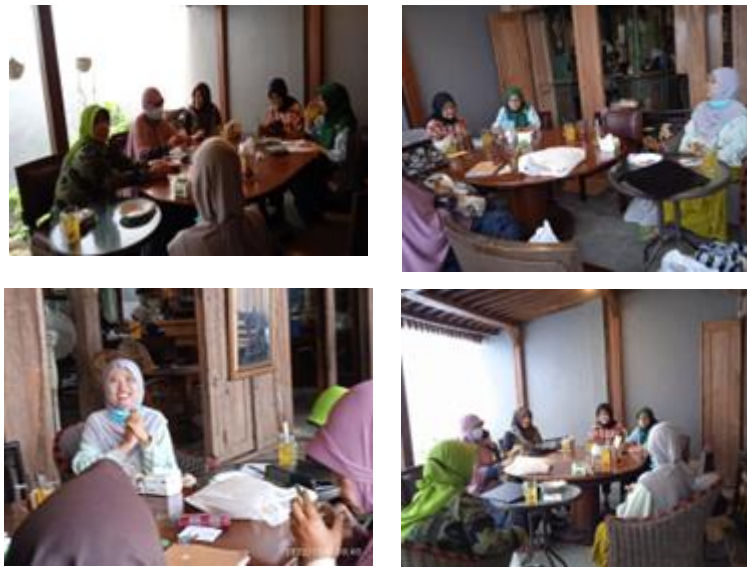
Gambar 2. Pemberian Edukasi Penggunaan Aplikasi Zoom