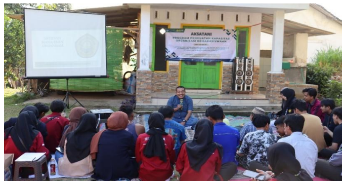
Gambar 5. Penyampaian materi manajemen organisasi

Pelatihan manajemen organisasi merupakan pelatihan pertama yang diadakan oleh tim pengabdian untuk mendukung terciptanya kelembagaan petani muda. Pelatihan manajemen organisasi bertujuan untuk menunjukkan pentingnya sebuah organisasi dalam pelaksanaan kegiatan guna mencapai suatu tujuan kolektif serta peran penting sumber daya manusia didalamnya. Sumber daya manusia berperan penting dalam sebuah organisasi sebab kinerja organisasi yang optimal membutuhkan pemanfaatan seluruh sumber daya yang dimiliki, salah satunya sumber daya manusia (Pahira & Rinaldy, 2023). Pelatihan manajemen organisasi ini menjadi bekal bagi peserta yang nantinya tergabung dalam kelembagaan sanggar tani muda. Peserta yang tergabung terdiri dari ketua kelompok tani dan pemuda pemudi Desa Sukowiryo.