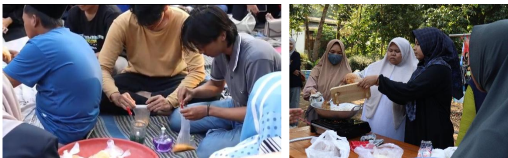
Gambar 7. Pelatihan pengolahan produk