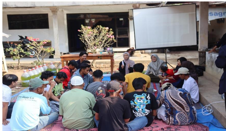
Gambar 6. Pembuatan POC dan pestisida nabati