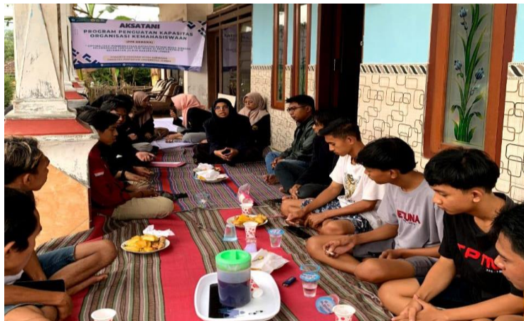
Gambar 3. Dokumentasi wawancara dengan masyarakat sasaran

Lokasi pelaksanaan kegiatan pengabdian masyarakat dilakukan di Desa Sukowiryo Kecamatan Jelbuk Kabupaten Jember. Pemilihan lokasi didasarkan pada potensi dan permasalahan yang selaras dengan jalannya program yang akan dilaksanakan. Berdasarkan hasil observasi lapang yang telah dilakukan terdapat penduduk dengan usia muda yang memiliki potensi meneruskan dan mengembangkan pertanian. Observasi awal dilakukan pada bulan Maret hingga Mei 2024, observasi dilakukan sebagai bentuk pemahaman kompleksitas dan dinamika permasalahan minimnya generasi muda yang menjadi petani di Desa Sukowiryo Kecamatan Jelbuk Kabupaten Jember. Pemahaman terhadap kondisi sosial masyarakat menjadi salah satu faktor penting yang menjadi pertimbangan kegiatan program. Observasi dilakukan pada awal dengan melihat bagaimana sektor pertanian dari hulu ke hilir, dan minat masyarakat muda dalam sektor pertanian di Desa Sukowiryo Kecamatan Jelbuk Kabupaten Jember. Observasi dilakukan menggunakan dua pendekatan yakni pendekatan partisipatoris serta wawancara untuk kemudahan pelaksanaan proses pendampingan. Pada saat observasi awal, pihak mitra akan membuat persetujuan MoU ( Memorandum of Understanding ) kemitraan dengan tim pelaksana PPK ORMAWA HIMASETA.