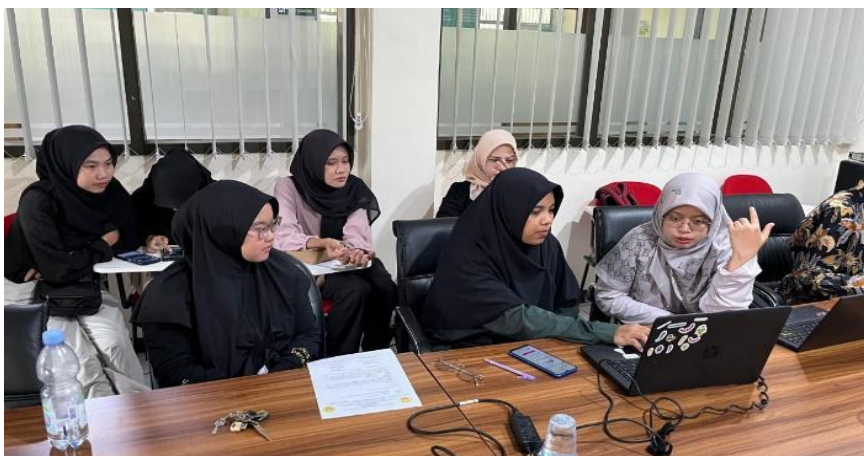
Gambar 2. Persiapan program sanggar tani muda AKSATANI

Tahap persiapan dimulai pada bulan Maret 2024 dengan menetapkan topik serta merancang program yang akan dilaksanakan dari awal hingga akhir pengabdian masyarakat melalui program peningkatan kapasitas organisasi (PPK ORMAWA) kemahasiswaan tahun 2024. Tahap awal yang dilakukan dengan melakukan survey lokasi kegiatan melalui diskusi dan interaksi dengan perangkat desa serta masyarakat sekitar dengan menganalisa potensi desa dan permasalahan di desa utamanya pada sektor pertanian. Hal tersebut menjadi acuan utama dalam penetapan topik yang diusung yaitu sanggar tani muda “AKSATANI : Optimalisasi Pemberdayaan Kapasitas Petani Muda Melalui Kelembagaan Sanggar Tani Muda di Desa Sukowiryo Kecamatan Jelbuk Kabupaten Jember” dengan melibatkan masyarakat di setiap dusun di Desa Sukowiryo utamanya masyarakat muda usia 15 hingga 39 tahun. Tahapan persiapan ini dilakukan dengan menetapkan lokasi, sasaran, dan judul program.