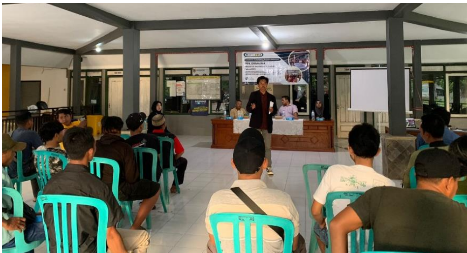
Gambar 4. Sosialisasi dan launching program AKSATANI

Sosialisasi dan launching program dilakukan di Balai Desa Sukowiryo pada 6 Juli 2024. Sosialisasi program ditujukan agar seluruh masyarakat dapat mengetahui program yang akan dilakukan serta memberikan pemahaman kepada masyarakat. Tujuan dari adanya sosialisasi program ini adalah untuk menyampaikan secara keseluruhan program yang akan dilaksanakan dengan tema sanggar tani muda AKSATANI yang berfokus pada pemberdayaan petani muda. Fokus kegiatan ini diarahkan pada pembentukan kelembagaan AKSATANI berbasis pemberdayaan masyarakat melalui kegiatan sektor pertanian dari hulu hingga hilir. Pelaksanaan program pengabdian ini dilakukan 4 pelatihan utama untuk keberlanjutan AKSATANI dan memberikan edukasi kepada masyarakat muda untuk terjun langsung dalam sektor pertanian sebagai bentuk upaya dalam regenerasi petani muda di Desa Sukowiryo.