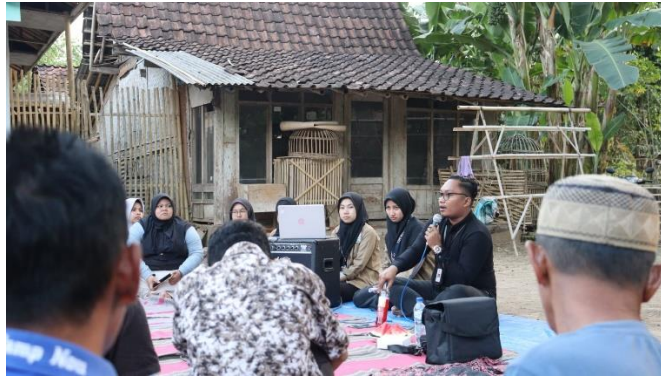
Gambar 8. Pelatihan pemasaran bersama Dinas Koperasi dan UMKM Kabupaten Jember