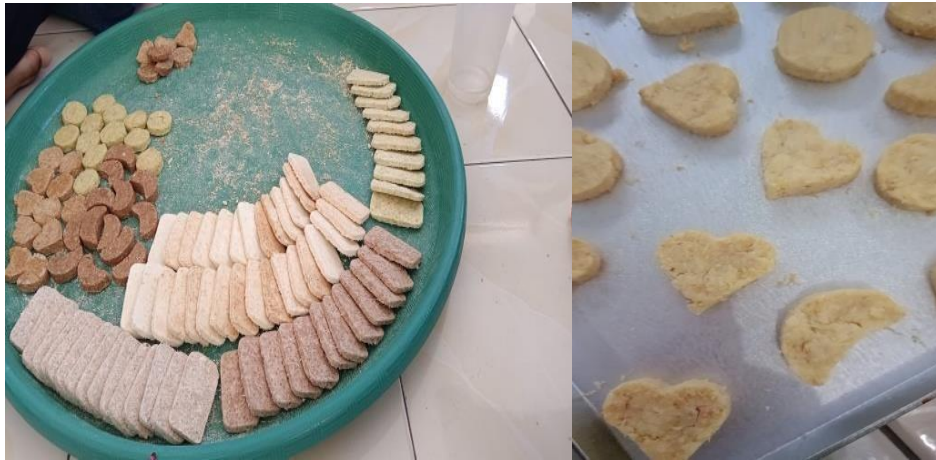
Gambar 2. Inovasi Bentuk dengan Rasa Terbaru pada Pengolahan Makanan Tradisional Sagon