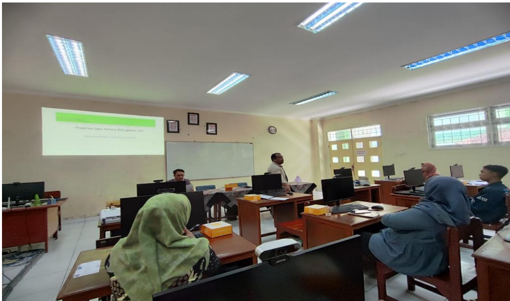
Gambar 3. Paparan Materi oleh Narasumber

Acara tersebut dihadiri oleh tim pengabdian dari FEB UNNES dan pengelola koperasi, yang dalam hal ini adalah para guru SMK Nurul Barqi, dengan total peserta sebanyak 14 orang. Ketua Koperasi Jasa Nurul Barqi memberikan apresiasi kepada tim FEB UNNES atas kerjasama dalam memajukan pendidikan perkoperasian di sekolah, yang mampu memberikan pembelajaran ekonomi kepada siswa. Kolaborasi antara akademisi perguruan tinggi dan pendidikan menengah sangat penting bagi kemajuan pendidikan nasional di Indonesia. Ketua tim pengabdian dari FEB UNNES juga berharap kegiatan ini dapat memberikan manfaat berupa pengetahuan, motivasi, dan keterampilan mengajar bagi para guru, sehingga mereka dapat mengubah cara pandang dalam pengelolaan koperasi sekolah dan meningkatkan kompetensi profesional mereka. Hal ini diharapkan dapat meningkatkan efektivitas, efisiensi, dan keberlanjutan pengelolaan koperasi.