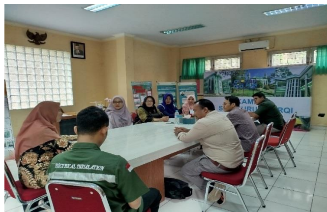
Gambar 2. Sambutan Ketua Pengabdian dan Ketua Koperasi

Tahap berikutnya dari program pengabdian ini adalah pelaksanaan workshop dan pendampingan terkait pengembangan digitalisasi tata kelola SHU. Kegiatan tersebut diadakan pada hari Selasa, 10 September 2024. Jadwal ini ditetapkan berdasarkan kesepakatan dan waktu yang tersedia antara tim pengabdian dan pengelola koperasi sekolah. Workshop berlangsung dari pukul 08.00 hingga 12.00 WIB, secara tatap muka di SMK Nurul Barqi, Semarang. Pemilihan lokasi ini karena sekolah tersebut merupakan kantor sekretariat dan memiliki fasilitas yang memadai untuk kegiatan ini.