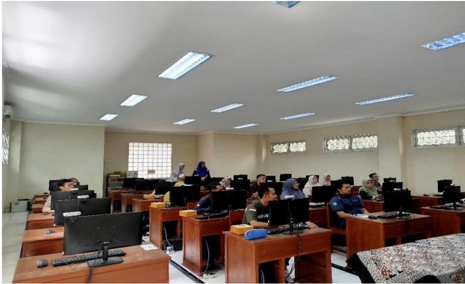
Gambar 4. Sesi FGD