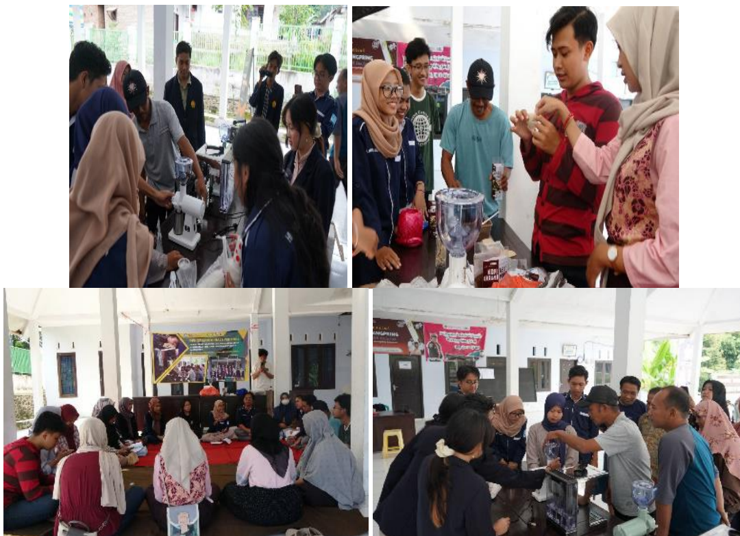
Gambar 2. Proses grinding biji kopi dan pengepakan bubuk kopi ke dalam pouch

Proses pembuatan kopi bubuk dimulai dengan pemilihan biji kopi yang berkualitas. Biji kopi yang telah dipanen kemudian diolah melalui proses roasting atau pemanggangan untuk menghasilkan aroma dan rasa yang khas (Nugroho et al. , 2021). Setelah itu, biji kopi yang telah dipanggang digiling menjadi bubuk halus sesuai dengan standar kualitas yang diinginkan. Tahap akhir dari proses ini adalah pengemasan produk kopi bubuk yang menarik dan memenuhi standar kebersihan. Pengemasan yang baik akan meningkatkan daya tarik produk di pasaran dan memperpanjang masa simpan kopi bubuk. Dengan proses ini, biji kopi mentah yang awalnya memiliki nilai jual rendah dapat diubah menjadi produk olahan dengan nilai tambah yang lebih tinggi. Untuk mendukung penerapan solusi ini, dibutuhkan praktik langsung yang melibatkan masyarakat petani di Desa Karangpring.