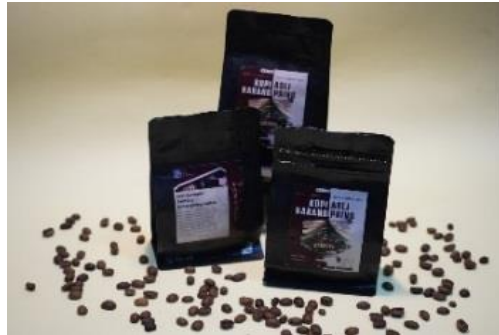
Gambar 3. Kemasan produk kopi bubuk