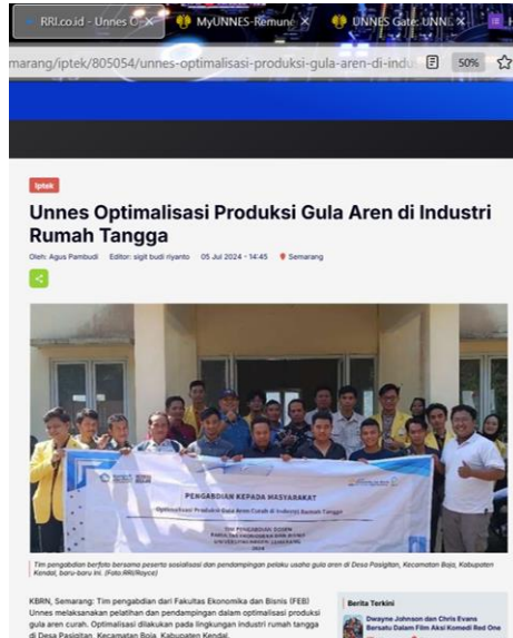
Gambar 2. Berita Media massa Online

pengabdian. Secara keseluruhan, kegiatan pengabdian ini memberikan dampak positif bagi industri rumah tangga gula aren di Desa Pasigitan. Produsen mendapatkan keterampilan baru, produk mereka menjadi lebih berkualitas, dan pasar mereka lebih luas, yang pada akhirnya meningkatkan pendapatan dan kesejahteraan masyarakat desa.