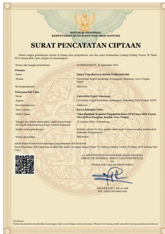
Gambar 3. Surat Pencatatan Ciptaan