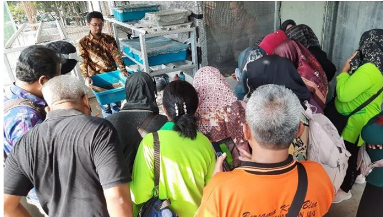
Gambar 11. Workshop di Kandang Maggot