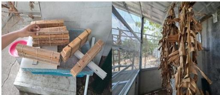
Gambar 8. Daun Pisang Kering dan Tempat Bertelur Maggot

Lalat BSF memerlukan kandang yang dilengkapi dengan jaring dan penyinaran matahari yang cukup untuk dapat bertelur. Proses metamorfosis lalat BSF menjadi maggot memakan waktu sekitar 21 hari. Seekor lalat BSF yang sehat dapat menghasilkan antara 185 hingga 1235 telur. Penetasan telur dilakukan pada media berbahan dasar dedak selama satu minggu, setelah itu baby maggot siap diberi makan lumpur limbah tahu. Setelah 21 hari, maggot dapat dipanen, baik dalam kondisi basah maupun setelah dikeringkan. Untuk meningkatkan daya tahan dan mempermudah distribusi, maggot sebaiknya dikeringkan terlebih dahulu. Saat ini, sudah ada dua siklus pertumbuhan maggot yang berhasil dijalankan. Pada siklus kedua, sebanyak 20 gram telur maggot dibagi ke dalam lima container box. Pemberian pakan maggot dilakukan setiap hari dengan perbandingan 2:1, di mana dua bagian terdiri dari lumpur limbah tahu, sementara satu bagian lainnya berupa bahan campuran seperti EM4, molase, dedak, dan sisa makanan. Penambahan molase dan EM4 bertujuan untuk mempercepat proses pembusukan sayuran atau buah-buahan yang sulit diurai oleh maggot, sedangkan dedak digunakan untuk memadatkan tekstur lumpur limbah tahu yang cenderung encer. Maggot yang dihasilkan dari siklus pertama telah diuji coba sebagai pakan untuk ayam, sementara sebagian lainnya ditetaskan menjadi lalat dewasa untuk melanjutkan siklus berikutnya.