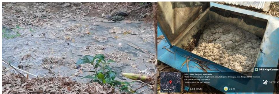
Gambar 3. Kondisi Sungai di Desa Sugihmanik dan Lumpur yang Meluap dari IPAL UKM Tahu

Kurang lebih terdapat 30 UKM tahu di Desa Sugihmanik dengan rata-rata produksinya mencapai 150 kg kedelai per hari untuk satu UKM, sehingga total kebutuhan kedelai per harinya sebesar 4 ton. Air limbah yang dihasilkan dari produksi 1 kg tahu sebesar 43 liter. Dari hasil pengujian terdahulu, didapatkan besarnya kandungan BOD5 limbah tahu berkisar antara 3.667 – 4.933 mg/L, COD 7.668 – 9.736 mg/L, dan nilai TSS pada kisaran 701-1.189 mg/L. Sedangkan BOD air sungai sebesar 367 mg/L dan COD 738 mg/L. Nilai tersebut melebihi nilai ambang batas yang ditetapkan Peraturan Daerah Provinsi Jawa Tengah Nomor 5 Tahun 2012. Pada awalnya IPAL tersebut beroperasi dengan baik, namun akibat pola perawatan yang tidak teratur oleh UKM tahu, IPAL yang dirancang tersebut belum berjalan secara optimal karena tingginya timbunan lumpur limbah tahu. Dampaknya, air sungai Desa Sugihmanik memiliki kandungan organik yang tinggi, sehingga menciptakan kondisi anaerobik yang menghasilkan produk penguraian amonia, karbon dioksida, asam asetat, dan metana. Senyawa tersebut menimbulkan bau busuk yang menyengat, berwarna hitam, merusak kualitas kesehatan air di sekitar sungai (Ditunjukkan pada Gambar 3).