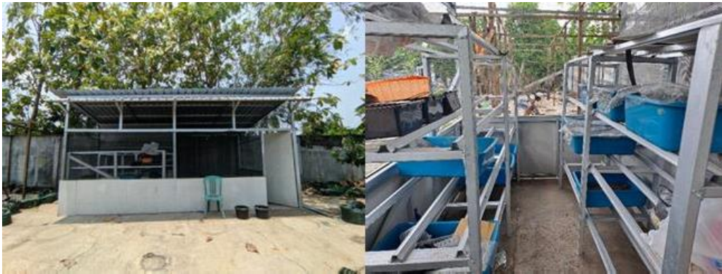
Gambar 7. Kandang Budidaya Maggot dan Rak untuk Container Box

Terdapat dua rak dengan tinggi sekitar 150 cm yang difungsikan sebagai tempat untuk meletakkan container box yang digunakan untuk pertumbuhan maggot. Setiap rak dapat menampung sekitar 10 container box , namun hanya 5 container box yang digunakan untuk proses pertumbuhan maggot. Untuk budidaya lalat BSF (Black Soldier Fly), fasilitas yang disediakan meliputi daun pisang kering sebagai tempat hinggap, balok kayu sebagai tempat bertelur, dan kotak tertutup yang berfungsi sebagai tempat penetasan pupa hingga menjadi lalat dewasa. Setiap hari, dilakukan penyemprotan pada daun pisang kering serta di sekitar kandang pertumbuhan lalat BSF untuk menjaga kelembaban. Lalat BSF dewasa hanya membutuhkan air sebagai sumber makanan.