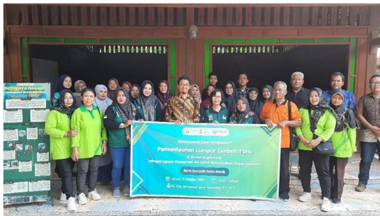
Gambar 10. Foto Bersama Warga Dusun Sugihmanik setelah Kegiatan Sosialisasi

Kegiatan sosialisasi yang dilakukan dalam program pemberdayaan ini menjadi salah satu tahap penting dalam mengenalkan konsep budidaya maggot kepada masyarakat Dusun Sugihmanik. Pada tahap ini, warga mulai menyadari potensi besar dari limbah organik yang sebelumnya dianggap sebagai masalah, khususnya limbah tahu, yang kini dapat dimanfaatkan secara lebih efektif. Melalui penjelasan yang disampaikan oleh tim pengabdian, warga diperkenalkan dengan ide bahwa limbah tahu dapat diolah menjadi pakan maggot, yang memiliki nilai jual tinggi sebagai pakan ternak.