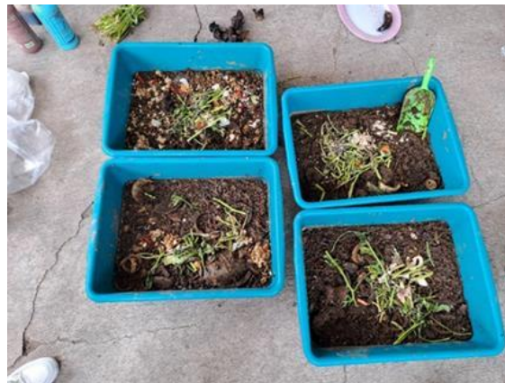
Gambar 9. Pemberian Makan pada Maggot