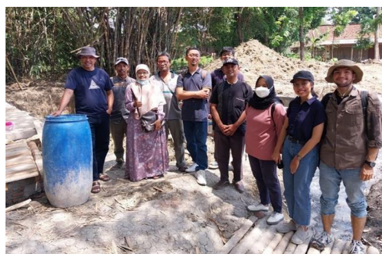
Gambar 2. Program Pembangunan IPAL Domestik Tahun 2021 di Desa Sugihmanik

Salah satu permasalahan umum terkait lingkungan yang dihadapi Desa Sugihmanik adalah buruknya pengelolaan persampahan. Belum optimalnya kegiatan daur ulang, penggunaan kembali, maupun reduksi sampah rumah tangga mendorong terbentuknya bank sampah di Desa Sugihmanik sebagai salah satu sarana pengelolaan sampah rumah tangga. Bank sampah merupakan sarana untuk pengelolaan sampah yang masih memiliki nilai ekonomi. Dengan adanya bank sampah, masyarakat menjadi lebih sadar akan pentingnya pengelolaan sampah dan adanya pengurangan sampah yang ditimbun di Tempat Pemrosesan Akhir (TPA). Cara kerja bank sampah hampir sama dengan bank secara umum, yaitu terdapat nasabah, manajemen pengelolaan, dan pencatatan pembukuan.