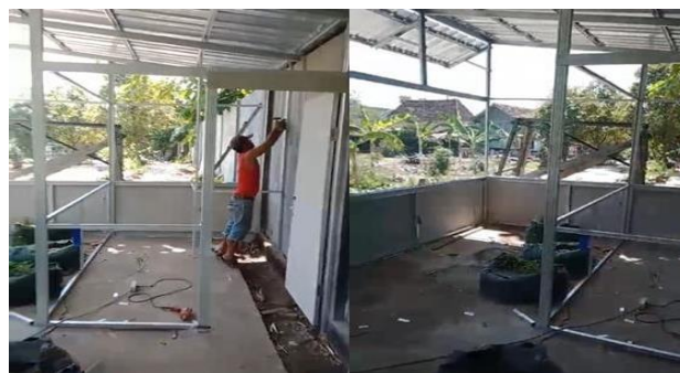
Gambar 6. Proses Pembuatan Kandang Budidaya Maggot