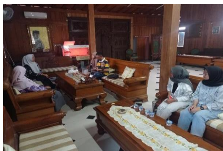
Gambar 4. Diskusi Bersama Dengan Pengurus Bank Sampah Krida Manik

Sosialisasi awal bertujuan untuk memberikan pemahaman mengenai program pemanfaatan lumpur limbah tahu menjadi pakan maggot kemudian maggot tersebut dimanfaatkan menjadi pakan ternak yang dapat memberikan manfaat ke masyarakat. Gambar 4 menunjukkan adanya diskusi dan kesepakatan awal terkait rencana program yang dilaksanakan dengan pengurus Bank Sampah Krida Manik yang menjadi mitra dalam program ini.