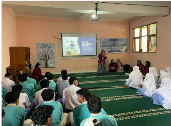
Gambar 2. Proses Penyampaian Materi Penyuluhan