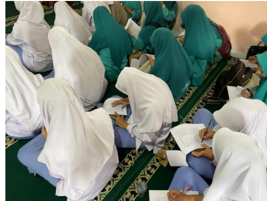
Gambar 3. Pemberian Pre Test dan Post Test

Saat kegiatan siswa diberikan pretest untuk mengetahui pemahaman para siswa terhadap obat psikofarmaka dan kesehatan mental. Setelah itu, pemaparan materi, siswa tidak hanya diberikan materi melalui power point, siswa juga diajak untuk aktif pada saat pemberian materi dengan memberi quiz dan hadiah agar siswa lebih antusias. Setelah itu, kegiatan post test kepada para siswa untuk mengetahui tingkat pemahaman terkait materi yang telah diberikan dalam bentuk power point, seperti pada Gambar 2. Dan Gambar 3.