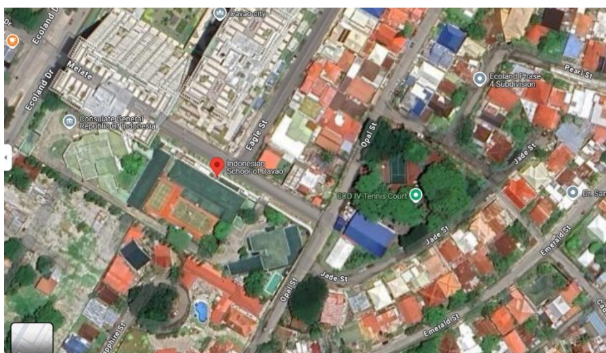
Gambar 1. Map Lokasi Kegiatan

Kegiatan pengabdian ini dilaksanakan secara daring (online) dengan mitra Sekolah Indonesia Davao (SID) yang terletak di Davao City, Filipina. Karena kondisi geografis yang berada di luar negeri, kegiatan ini dilakukan melalui platform daring guna mengatasi keterbatasan jarak dan memastikan keterlibatan aktif antara tim pengabdian dan guru-guru di SID. Melalui pendekatan ini, diharapkan dapat memberikan dukungan secara efektif terhadap implementasi Kurikulum Merdeka serta penguatan kompetensi dan karakter siswa melalui Proyek Penguatan Profil Pelajar Pancasila (P5) yang lebih kontekstual dengan situasi di SID.