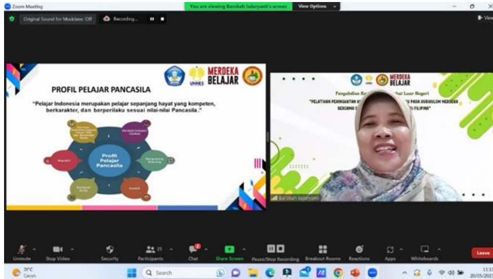
Gambar 3. Pemaparan Materi 2 Tentang Penguatan Proyek Profil Pelajar Pancasila Dalam Implementasi Kurikulum Merdeka

Selain itu, juga dibahas tentang platform-platform yang dapat mendukung proses pembelajaran di Kurikulum Merdeka.