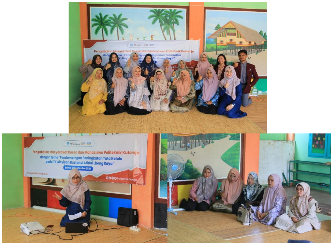
Gambar 2. Tim memberikan materi

Selama pelaksanaan kegiatan, tim pengabdian menerapkan langkah-langkah sistematis untuk memastikan keberhasilan program tata kelola keuangan di TK Bustanul Athfal Lhong Raya, Banda Aceh Lhong Raya. Pengumpulan data dilakukan secara menyeluruh untuk mengevaluasi perkembangan peserta, baik dari segi pengetahuan maupun keterampilan, melalui pendekatan kuantitatif dan kualitatif. Setiap tahapan kegiatan terdokumentasi dengan baik, mulai dari proses perencanaan hingga pelaksanaan. Untuk evaluasi, tim pengabdian menggunakan beberapa instrumen, termasuk observasi langsung selama kegiatan berlangsung untuk menilai keterlibatan peserta dan kemampuan mereka dalam menyusun anggaran, mencatat arus kas, serta membuat laporan keuangan. Selain itu, monitoring pasca-pelatihan dilakukan oleh tim monitoring dan evaluasi (Monev) untuk memastikan penerapan materi yang telah diajarkan. Monitoring ini mencakup pendampingan peserta dalam implementasi tata kelola keuangan di lingkungan TK secara nyata. Kombinasi observasi langsung dan monitoring pasca-pelatihan memberikan gambaran yang lebih komprehensif mengenai keberhasilan program, termasuk tingkat pemahaman peserta dan dampak nyata dari pelatihan tersebut dalam praktik sehari-hari.