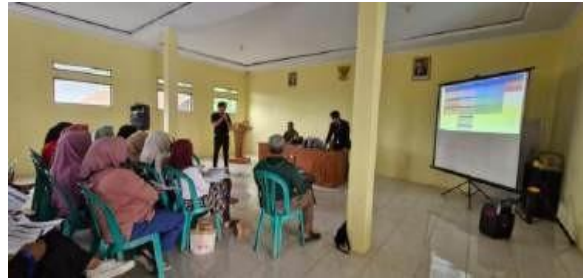
Gambar 5. Penyampaian Materi design thinking