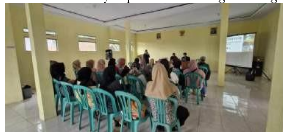
Gambar 6. Penyampaian Materi Pemasaran Digital

Tahap pelatihan berikutnya dilaksanakan pada tanggal 12 September 2024, dengan materi lanjutan mengenai pentingnya packaging dan legalitas usaha, khususnya untuk produk makanan. Pelatihan ini bertujuan memberikan wawasan kepada UMKM mengenai peran kemasan yang menarik dalam meningkatkan daya tarik produk serta pentingnya memiliki izin usaha untuk mendukung kepercayaan konsumen. Peserta diberikan contoh-contoh kemasan yang efektif serta langkah-langkah dasar untuk mengurus legalitas usaha. Dari hasil evaluasi, terlihat bahwa beberapa UMKM telah mulai memperbaiki tampilan kemasan produknya agar lebih menarik dan sesuai dengan preferensi konsumen. Beberapa pelaku UMKM juga termotivasi untuk memulai proses pengurusan izin usaha dasar, menyadari pentingnya legalitas sebagai bagian dari upaya meningkatkan nilai dan kepercayaan terhadap produk mereka.