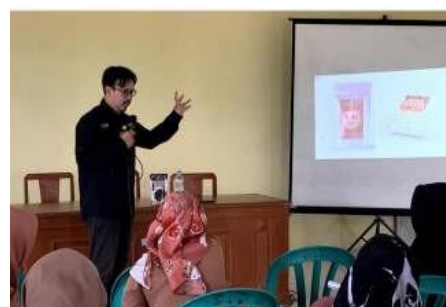
Gambar 8. Penyampaian Materi Packaging Product