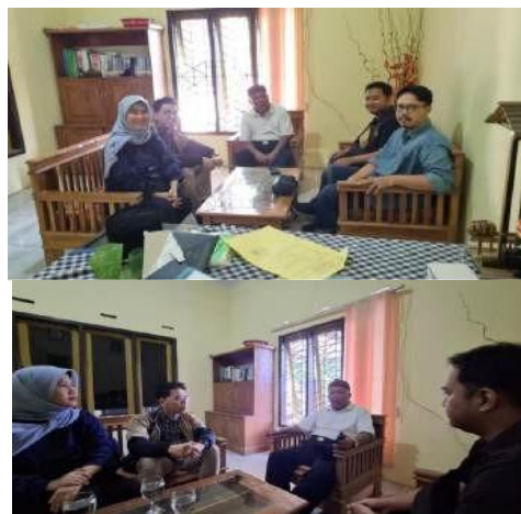
Gambar 3. Kegiatan Inisiasi Awal

Program Penguatan UMKM Desa Binaan Berbasis SDGs Digital di Santanamekar dilaksanakan dengan beberapa tahapan yang terstruktur, dimulai dari inisiasi program hingga pendampingan dan evaluasi capaian UMKM yang bertujuan untuk membangun kapasitas UMKM melalui berbagai pelatihan dan pendampingan. Kegiatan program dimulai dengan tahapan inisiasi pada tanggal 24 Juli 2024, di mana tim dari Universitas Pendidikan Indonesia Kampus Tasikmalaya mengunjungi Desa Santanamekar untuk memperkenalkan program sekaligus melakukan analisis awal atas permasalahan yang dihadapi oleh UMKM. Dalam inisiasi ini, ditemukan bahwa para pelaku UMKM di Santanamekar memiliki potensi besar dalam produk kuliner dan kerajinan, tetapi menghadapi kendala utama dalam aspek pemasaran digital, kemasan produk, dan legalitas usaha. Temuan ini menjadi landasan dalam perancangan materi pelatihan agar sesuai dengan kebutuhan spesifik UMKM setempat.