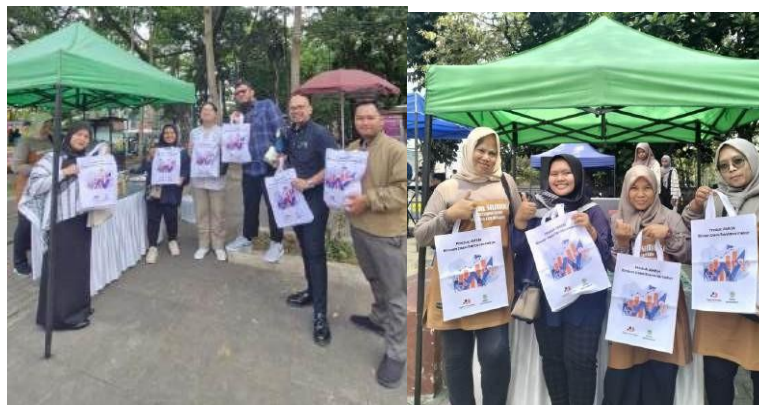
Gambar 10. Pelaksanaan Bazar

Pada puncak kegiatan, tanggal 2 November 2024, dilaksanakan acara bazar UMKM di GCC Tasikmalaya. Acara ini melibatkan tiga UMKM dari Desa Santanamekar yang berpartisipasi sebagai perwakilan untuk mempromosikan produk mereka secara langsung kepada masyarakat luas. Bazar ini tidak hanya menjadi kesempatan bagi UMKM untuk memasarkan produknya tetapi juga sebagai media implementasi nyata dari materi pelatihan yang telah diterima. Selain itu, kegiatan ini memberikan pengalaman langsung bagi peserta dalam berinteraksi dengan konsumen, berkomunikasi mengenai nilai produk, dan mempraktikkan keterampilan pemasaran yang telah dipelajari. Hasil dari kegiatan ini sangat positif, di mana UMKM peserta bazar mampu menarik perhatian konsumen, menjual produk, dan mendapatkan umpan balik yang konstruktif untuk pengembangan produk di masa mendatang.