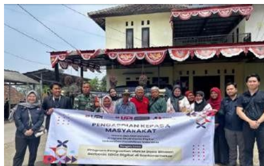
Gambar 4. Kegiatan Pengabdian bersama UMKM

Pada tanggal 22 Agustus 2024, dilaksanakan sesi pertama pelatihan dengan fokus pada pemasaran digital dan design thinking . Sesi ini dihadiri oleh UMKM di Desa Santanamekar dan bertujuan untuk memperkenalkan pentingnya memanfaatkan media sosial dan platform digital dalam memperluas pasar. Peserta diajarkan bagaimana cara merancang strategi pemasaran yang menarik dan relevan dengan kebutuhan konsumen. Pendekatan design thinking diperkenalkan sebagai metode untuk mengembangkan kreativitas dalam memahami kebutuhan konsumen serta membuat keputusan bisnis yang lebih berorientasi pada pasar. Hasil dari sesi ini menunjukkan bahwa para peserta mulai mengadopsi strategi pemasaran digital sederhana, seperti memanfaatkan media sosial untuk menjangkau pelanggan lebih luas.