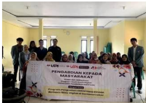
Gambar 9. Foto bersama UMKM Desa Santanamekar

Pada puncak kegiatan, tanggal 2 November 2024, dilaksanakan acara bazar UMKM di GCC Tasikmalaya. Acara ini melibatkan tiga UMKM dari Desa Santanamekar yang berpartisipasi sebagai perwakilan untuk mempromosikan produk mereka secara langsung kepada masyarakat luas. Bazar ini tidak hanya menjadi kesempatan bagi UMKM untuk memasarkan produknya tetapi juga sebagai media implementasi nyata dari materi pelatihan yang telah diterima. Selain itu, kegiatan ini memberikan pengalaman langsung bagi peserta dalam berinteraksi dengan konsumen, berkomunikasi mengenai nilai produk, dan mempraktikkan keterampilan pemasaran yang telah dipelajari. Hasil dari kegiatan ini sangat positif, di mana UMKM peserta bazar mampu menarik perhatian konsumen, menjual produk, dan mendapatkan umpan balik yang konstruktif untuk pengembangan produk di masa mendatang.