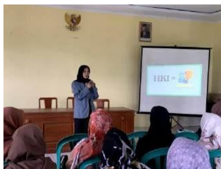
Gambar 7. Penyampaian Materi Legalitas produk

Tahap pelatihan berikutnya dilaksanakan pada tanggal 12 September 2024, dengan materi lanjutan mengenai pentingnya packaging dan legalitas usaha, khususnya untuk produk makanan. Pelatihan ini bertujuan memberikan wawasan kepada UMKM mengenai peran kemasan yang menarik dalam meningkatkan daya tarik produk serta pentingnya memiliki izin usaha untuk mendukung kepercayaan konsumen. Peserta diberikan contoh-contoh kemasan yang efektif serta langkah-langkah dasar untuk mengurus legalitas usaha. Dari hasil evaluasi, terlihat bahwa beberapa UMKM telah mulai memperbaiki tampilan kemasan produknya agar lebih menarik dan sesuai dengan preferensi konsumen. Beberapa pelaku UMKM juga termotivasi untuk memulai proses pengurusan izin usaha dasar, menyadari pentingnya legalitas sebagai bagian dari upaya meningkatkan nilai dan kepercayaan terhadap produk mereka.