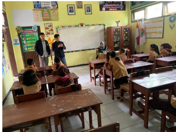
Gambar 4. Mendengarkan Cerita

Kegiatan kedua, tim pelaksana menjelaskan bagaimana cara membangun public speaking kepada siswa-siswi kelas 3. Tim pelaksana memberikan satu contoh penerapan public speaking yang mendasar yaitu dengan membacakan sebuah cerita dongeng kepada siswa siswi kelas 3. Setelah menceritakan dongeng, tim memberikan pertanyaan atau berdiskusi santai dengan siswa-siswi terkait cerita yang telah di bacakan. Penceritaan dan diskusi tersebut juga menguji pemahaman mereka.