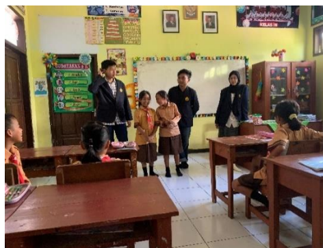
Gambar 3. Kegiatan Perkenalan

Kegiatan proyek sosial dilakukan di SDN Gadingsari, Kabupaten Bondowoso, Jawa Timur. Kegiatan ini melibatkan siswa-siswi kelas 3 yang berjumlah 15 anak. Kegiatan ini dilakukan 4 kali pertemuan dalam satu bulan yaitu di tanggal 12 April-03 Mei 2025. Sebelum menerapkan kegiatan pertama, tim pelaksana melakukan observasi ke SDN Gadingsari dan berdiskusi dengan kepala sekolah untuk meminta izin melakukan proyek sosial di SDN Gadingsari. Tim pelaksana diminta untuk membawa surat perizinan dari pihak universitas. Setelah diizinkan minggu berikutnya tim pelaksana bisa langsung memulai kegiatan proyek sosial. Berikut kegiatan-kegiatan proyek sosial di SDN Gadingsari. Kegiatan pertama yaitu hari pertama proyek sosial di SDN Gadingsari, tim pelaksana melakukan perkenalan yang merupakan awal dari sebuah kegiatan. Tim pelaksana memperkenalkan diri terlebih dahulu dan dilanjutkan oleh siswa-siswi kelas 3 SDN Gadingsari satu persatu. Format perkenalan untuk siswa yaitu nama, asal, dan hobi. Setelah perkenalan, tim pelaksana menjelaskan tujuan dan tema proyek sosial kepada siswa-siswi kelas 3 agar mereka terdapat gambaran dan paham akan kegiatan kedepannya nanti.