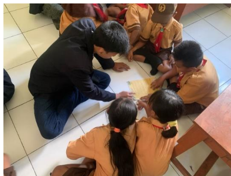
Gambar 6. Belajar Intonasi

Kegiatan keempat merupakan kegiatan yang terfokus pada public speaking. Kegiatan ini bisa diawali dengan kegiatan public speaking dasar yaitu belajar intonasi lewat selembarnya kertas yang berisi cerita dongeng. Pertama-tama tim pelaksana membentuk 3 kelompok, dimana masing-masing kelompok terdiri dari 4-5 anak dan satu pendamping dari tim pelaksana. Setiap kelompok diberikan selembarnya kertas yang berisikan cerita dongeng, lalu tim pelaksana mengajarkan cara berlatih membaca cerita dongeng tersebut dengan baik, sesuai tangga nada, dan tanda baca yang benar atau intonasi. Setelah berlatih membaca sesuai dengan intonasi, masing-masing per kelompok maju ke depan kelas untuk membacakan cerita dongeng tadi sesuai dengan intonasi yang baik dan benar secara bergantian, sambil didampingi pendamping dari tim pelaksana.