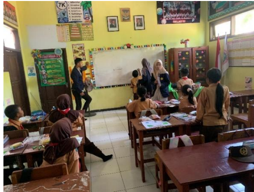
Gambar 8. Apresiasi Penutup