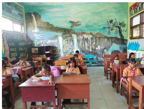
Gambar 5. Membaca Bersama

Kegiatan ketiga yang dilihat dari gambar diatas kegiatannya yaitu membaca buku. Peminjaman buku ini tim pelaksana mengajak siswa-siswi untuk ke perpustakaan guna meminjam buku untuk dibaca. Setelah peminjaman buku, tim pelaksana mengajak kembali ke ruangan kelas dan melanjutkan baca buku yang telah dipilih siswa-siswi sesuai selera mereka. Sesi baca buku ini diberikan waktu 20-230 menit. Tim pelaksana mengamati dan mengajarkan siswa-siswi apabila terdapat kesulitan dalam membaca. Selesai sesi membaca salah satu siswa-siswi diminta untuk maju kedepan dan menceritakan ulang apa yang telah mereka baca dan dapatkan dari hasil membaca buku selama 20-30 menit. Setelah itu, kami mengadakan ice breaking yang merupakan kegiatan bermain-main supaya tidak jenuh dalam kegiatan. Ice breaking yang dilakukan yaitu ice breaking fokus, dimana cara bermainnya yaitu dari tim pelaksana sebagai intruksi dan siswa-siswi harus mengikuti ice breaking tersebut dengan teratur. Siswa-siswi yang tidak sesuai dengan aturan atau salah dalam ice breaking , maka sisw-siswi tersebut berhak mendapatkan sanksi berupa nyanyi di depan kelas.