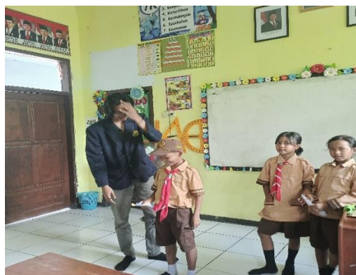
Gambar 7. Ungkapkan Cita-cita

Kegiatan ke lima yaitu kegiatan “ungkapkan cita-cita anda”, yang mana ini nantinya siswa-siswi maju ke depan kelas untuk mengungkapkan cita-citanya. Pertama-tama yang dilakukan yaitu tim pelaksana membuat potongan gambar-gambar cita-cita, terdapat gambar polisi, guru, dokter, dan banyak lagi. Siswa-siswi bergantian untuk maju ke depan dan memilih gambar yang sesuai dengan apa yang di cita-citakan. Siswa-siswi dituntut mengungkapkan alasan memilih gambar cita-cita tersebut, dan mengungkapkannya di depan teman-temannya. Apabila cita-citanya tidak terdapat dalam gambar yang tim pelaksana bawa, maka siswa atau siswi tadi bisa langsung mengungkapkan apa cita-citanya dengan memperagakan bagaimana cita-citanya itu.