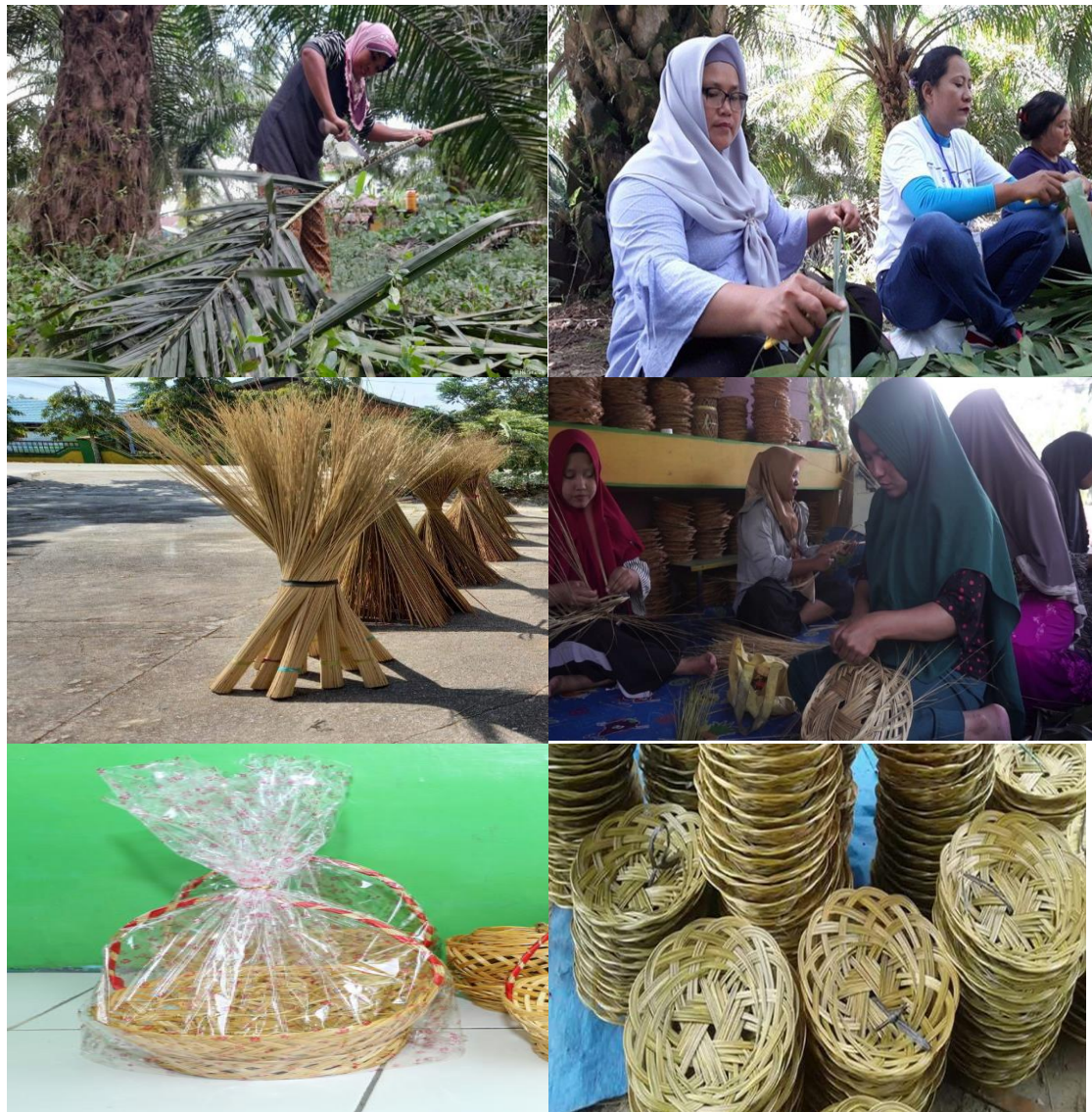
Gambar 2. Lampiran Kegiatan Penelitian Usaha Kerajinan Lidi Kelapa Sawit masyarakat desa di Kecamatan Pematang Bandar, Kabupaten Simalungun

Dari data diatas dapat dilihat bahwa produksi dari hasil kerajinan masyarakat desa Kecamatan Pematang Bandar, Kabupaten Simalungun dalam mengelola lidi kelapa sawit sangat menjanjikan dalam meningkatkan pendapatan dan membantu pertumbuhan perekonomian keluarga. Hal ini dapat diketahui bahwa, nilai (omzet) produksi olahan tas dan lain-lain yang berbahan lidi kelapa sawit dapat menyumbang pendapatan sebesar Rp.319.695.000,- per bulannya. Dengan begitu pengolahan lidi kelapa sawit ini sangat menjanjikan dalam membantu pertumbuhan ekonomi masyarakat desa di Kecamatan Pematang Bandar, Kabupaten Simalungun. Selain itu, dari mengolah lidi menjadi sebuah produk kerajinan, lidi kelapa sawit juga di ekspor dari Kabupaten Simalungun ke luar negeri, seperti India, Uzbekistan, dan Jepang. Dengan begitu, permintaan akan ketersediaan lidi kelapa sawit semakin meningkat dan membuat masyarakat berbondong-bondong mencari lidi kelapa sawit baik dari perkebunan perusahaan milik negara maupun perkebunan masyarakat sekitar.