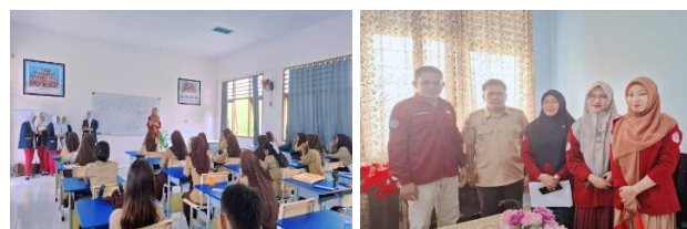
Gambar 2. Pelaksanaan Pengabdian Kepada Masyarakat

Masyarakat yang menerima hasil pengabdian ini adalah anak usia remaja 14-17 tahun SMKN 3 Raha dengan dampak secara langsung dari hasil kegiatan pengabdian ini berupa kemampuan para remaja menyebutkan arti dan pentingnya kesehatan mental remaja, faktor-faktor yang mempengaruhi kesehatan mental, tanda-tanda gangguan mental remaja, bentuk gangguan psikologis remaja, peran edukasi kesehatan dalam mencegah atau mengurangi risiko gangguan psikologis remaja, cara menjaga dan meningkatkan kesehatan mental.