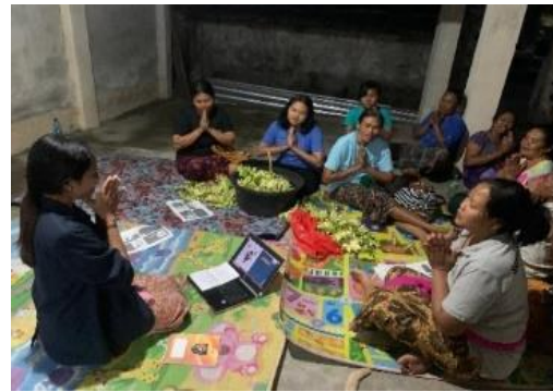
(b) Kegiatan Sosialisasi