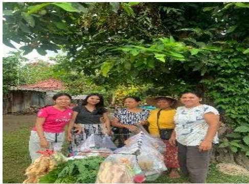
(a) Kegiatan observasi

menjadi lebih tertata, sementara 90% menilai buku kas mudah digunakan dan 70% menyatakan siap melanjutkan pencatatan setelah program berakhir. Evaluasi juga dilakukan melalui pemeriksaan langsung isi buku kas, yang memperlihatkan sebagian besar peserta mampu mencatat tanggal, pendapatan, pengeluaran, serta saldo akhir dengan cukup baik, meskipun masih muncul kendala berupa kebiasaan mengabaikan pengeluaran kecil yang dianggap sepele.