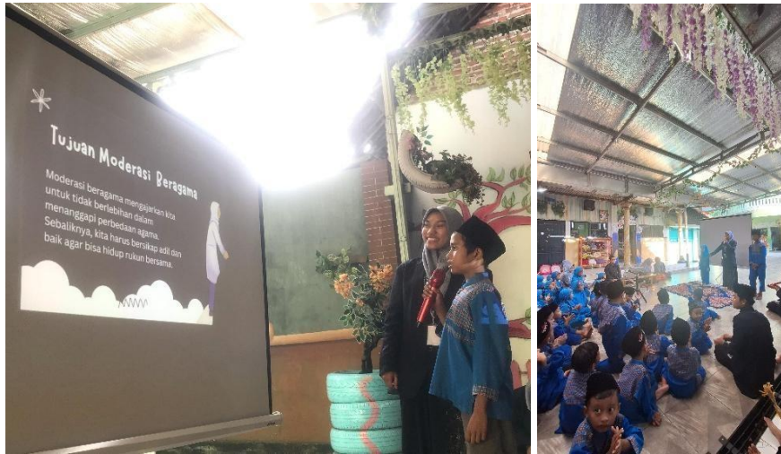
Gambar 3. Kegiatan Sosialisasi

dibutuhkan, mengingat keterbatasan pengetahuan yang ada saat ini. Lembaga pendidikan perlu memberikan perhatian khusus dengan menyelenggarakan program edukasi yang terstruktur agar santri dapat lebih responsif dalam menyikapi perbedaan (Rofik & Misbah, 2021).