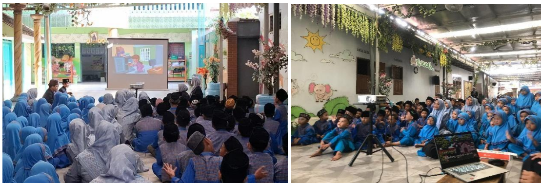
Gambar 4. Kegiatan Penayangan video animasi

Kegiatan simulasi video dilaksanakan di aula TPQ, di mana santri dibimbing untuk mempraktikkan penyelesaian konflik dalam berbagai situasi yang telah disiapkan. Tujuan dari kegiatan ini adalah untuk memastikan bahwa santri memahami prinsip-prinsip dasar toleransi dengan baik. Selama pelaksanaan, terlihat bahwa santri menunjukkan antusiasme yang tinggi selama penayangan video. Hal ini tercermin dari keseriusan mereka dalam mengikuti setiap tahapan serta ketepatan dalam menerapkan solusi yang moderat ketika menghadapi skenario konflik yang diberikan.