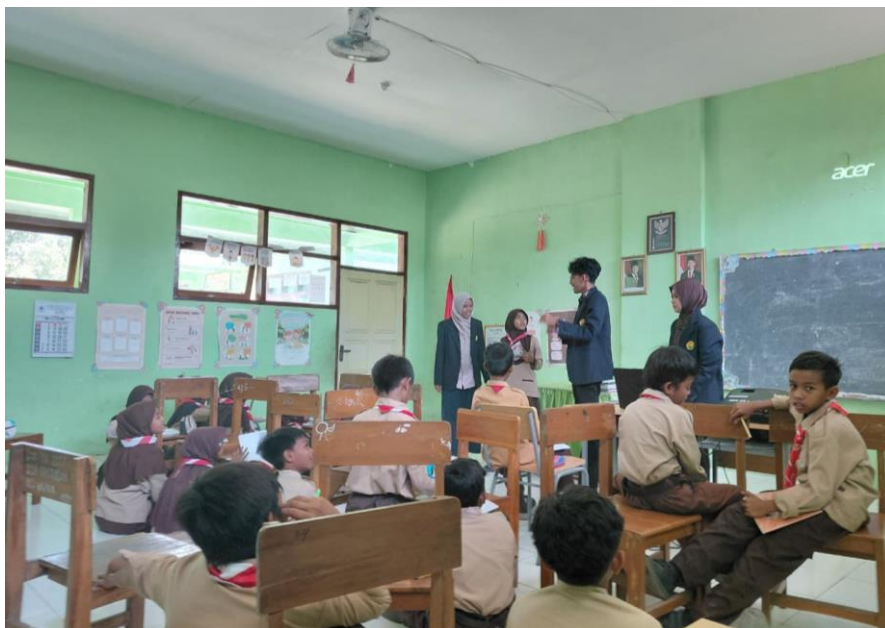
Gambar 2. Kegiatan penyampaian materi pendidikan karakter pada peserta didik.

Proyek sosial ini menunjukkan bahwa pendidikan karakter berfungsi sebagai landasan pengembangan nilai moral dan etika peserta didik, yang sangat penting di era globalisasi di mana peserta didik mudah terpengaruh oleh berbagai nilai asing (Gowasa dkk., 2024). Pendidikan karakter di era globalisasi terbukti mampu membentuk karakter dan nilai moral peserta didik secara bertahap. Metode penyampaian materi secara langsung yang disertai permainan ice breaking terbukti dapat meningkatkan daya ingat peserta didik. Hal ini sejalan dengan pernyataan bahwa pendidikan karakter berperan penting dalam membentuk kepribadian positif peserta didik sejak dini sehingga dapat mencegah kenakalan remaja dan perilaku menyimpang lainnya (Amran dkk., 2018).