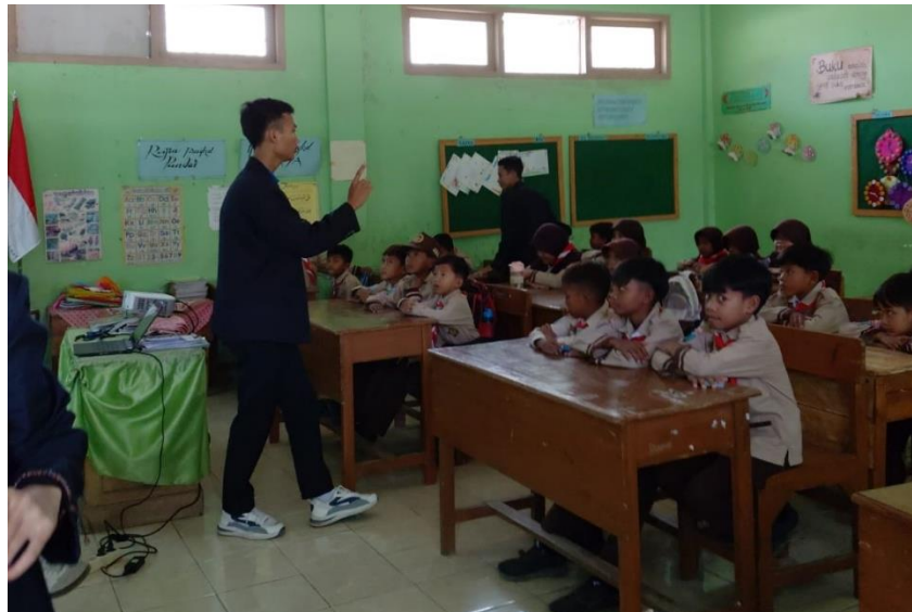
Gambar 3. Kegiatan diskusi materi bersama peserta didik SDN Grujukan 1.

Pada pertemuan pertama, mahasiswa melakukan kegiatan perkenalan dengan siswa-siswi SDN Grujukan 1 guna membangun kedekatan dan ikatan kekeluargaan antara mahasiswa dan peserta didik. Setelah sesi perkenalan, mahasiswa menyampaikan materi dasar bertema "Pentingnya Pendidikan Karakter" agar peserta didik memahami nilai moral dan etika dalam kehidupan di era globalisasi. Di sela-sela penyampaian materi, diterapkan ice breaking agar peserta didik tetap bersemangat dan lebih mudah menyerap materi yang disampaikan.