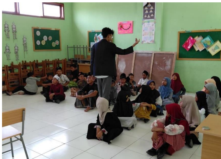
Gambar 4. Kegiatan penyampaian materi pendidikan karakter pada peserta didik.

Pada pertemuan kedua, kegiatan difokuskan pada pelaksanaan pre-test terkait pendidikan karakter di era globalisasi. Pre-test berisi 15 soal yang diberikan kepada peserta didik untuk mengukur tingkat pengetahuan awal mereka sebelum materi lebih lanjut disampaikan. Data hasil pre-test digunakan sebagai acuan mahasiswa dalam menilai pemahaman awal peserta didik. Pada pertemuan ini juga diberikan permainan ice breaking yang berkaitan dengan materi "Pendidikan Karakter di Era Globalisasi" guna membangun semangat dan rasa kebersamaan. Melalui permainan tersebut, peserta didik mulai memahami dan lebih mudah menerima materi yang telah disampaikan sebelumnya.