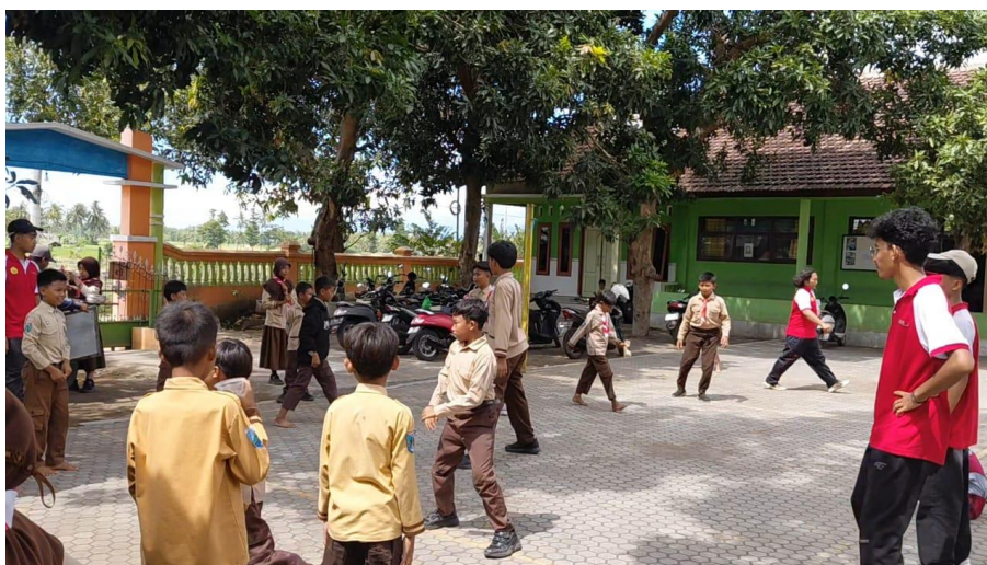
Gambar 6. Kegiatan ice breaking bersama siswa-siswi SDN Grujukan 1.

Berdasarkan grafik tersebut, kegiatan yang dilaksanakan dalam tiga kali pertemuan berhasil mencapai target yang diharapkan, dengan nilai rata-rata kelas di atas 8. Hasil ini sejalan dengan teori pendidikan karakter yang menekankan bahwa pembentukan nilai moral harus dilakukan melalui model pembelajaran aktif dan pengalaman langsung (Amelia, 2022). Keterlibatan siswa secara emosional dan sosial melalui sesi ice breaking , diskusi, dan permainan edukatif terbukti meningkatkan keterikatan mereka terhadap materi. Penyampaian materi berbasis media visual juga mendapat respons positif dari peserta didik maupun pihak sekolah, sehingga proyek sosial ini dinilai sangat dibutuhkan oleh siswa dan pengelola sekolah.