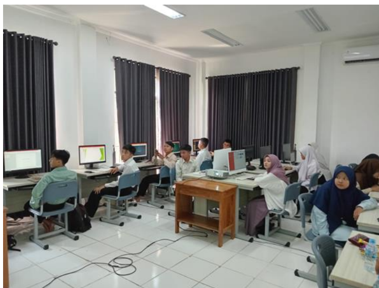
Gambar 3. Peserta Pelatihan