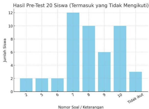
Gambar 14. Hasil rata-rata nilai pre-test siswa dalam memahami materi potensi diri melalui program unjuk bakat

Guru memegang peran penting dalam pengembangan bakat dan minat anak di sekolah. Mereka memiliki kesempatan untuk mengamati dan mengidentifikasi minat serta bakat yang dimiliki oleh masing-masing siswa. Dengan pemahaman tersebut, guru dapat merancang pembelajaran yang relevan dan menarik, memungkinkan anak-anak untuk mengeksplorasi minat dan bakat mereka secara lebih dalam (Zubaidah, Alhamdika, Setiawati, & Aryanto, 2024). Berjalannya kegiatan pengabdian masyarakat dengan mengkaji potensi diri pada usia anak praremaja menjadi salah satu cara untuk memudahkan peran guru dalam mengidentifikasi minat serta bakat yang dimiliki. Bakat dan minat yang berbeda disebabkan oleh keterampilan di bidang akademik dan nonakademik yang berbeda pula (Atmijaya & Andaryani, 2024). Mengenali potensi diri merupakan hal yang krusial untuk bekal di masa depan dan memudahkan dalam pencarian jati diri anak di kemudian hari yang berdampak pada pertumbuhan karakter. Persoalannya, tidak semua individu mampu mengenali potensi diri mereka sejak usia praremaja sehingga perlu adanya dorongan dan pendampingan secara mendalam untuk mencapai pengetahuan minat dan bakat pada anak yang berkaitan dengan karakter kepribadian.