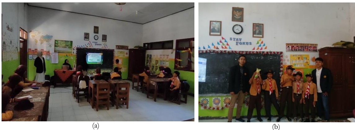
Gambar 6. (a) Pemberian materi mengenai perbedaan potensi dan bakat beserta contohnya terhadap peserta didik SD Negeri Dukuh Mencek 04 Jember, (b) Pemberian penghargaan terhadap kelompok peraih poin terbanyak

Pada Gambar 6 (a) menunjukkan tahap pemberian materi pada minggu kedua terkait perbedaan potensi dan bakat beserta contohnya dalam upaya menanamkan pemahaman yang mendalam bagi para peserta didik SD Negeri Dukuh Mencek 04 Jember. Agar memudahkan penyampaian materi, peserta didik diarahkan untuk membentuk kelompok sesuai dengan hasil pre-test pada minggu