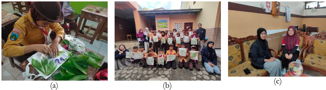
Gambar 13. (a) Keterampilan ecoprint , (b) Pemberian tanda mata pada wali kelas dan peserta didik SD Negeri Dukuh Mencek 04 Jember, (c) Kesan dan pesan wali kelas terhadap kegiatan pengabdian masyarakat

Kegiatan pengabdian masyarakat yang dilaksanakan dalam kurun waktu 4 minggu ditutup dengan pembuatan ecoprint pada totebag sebagai salah satu bakat keterampilan pengolahan kreativitas pada anak usia praremaja. Kegiatan mendapatkan respons yang baik dan pihak sekolah sangat senang dengan kedatangan mahasiswa UNEJ dalam melakukan kegiatan pengabdian masyarakat. Wawancara singkat dilakukan pada wali kelas 5 SD Negeri Dukuh Mencek 04 Jember terkait dengan kegiatan pengabdian masyarakat yang dilakukan. Kegiatan diakhiri dengan memberikan parcel buah sebagai bentuk rasa terima kasih yang mendalam terhadap pihak sekolah SD Negeri Dukuh Mencek 04 Jember.