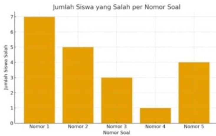
Gambar 15. Hasil rata-rata nilai post-test siswa dalam memahami materi potensi diri melalui program unjuk bakat

Pre-test terdapat dua jenis yang berbeda, yaitu tes kognitif sederhana dan tes pemahaman. Pada bagian kognitif siswa diberikan soal-soal logika dan berhitung dasar untuk mengukur kemampuan berpikir kritis dan melihat pemahaman situasi para siswa. Pada bagian pemahaman bacaan siswa membaca cerita tentang motivasi Rama untuk bersekolah kemudian mereka menjawab pertanyaan terkait isi cerita, motivasi belajar. Pre-test bertujuan mengetahui kemampuan awal para siswa dalam berpikir logis, memahami bacaan, mengetahui motivasi dan minat belajar mereka. Setelah dilakukan pre-test , para siswa sudah mulai mengenali apa saja kemampuan, hobi, minat, maupun motivasi belajar mereka. Namun, anak-anak masih belum mampu dalam berpikir kritis dan memahami situasi yang terdapat pada soal-soal logika.