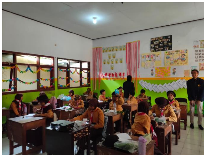
Gambar 12. Pengerjaan post-test oleh peserta didik kelas 5 SD Negeri Dukuh Mencek 04 Jember

Sebelum mengakhiri kegiatan pada minggu ketiga, dilakukan foto bersama sebagai tanda berakhirnya pentas unjuk bakat kelas 5 SD Negeri Dukuh Mencek 04 Jember. Wali kelas juga diajak untuk mengapresiasi bersama semua peserta didik kelas 5 SD Negeri Dukuh Mencek 04 Jember yang dengan percaya dirinya telah menampilkan potensi dan bakat di hadapan teman kelasnya. Pentas unjuk bakat diharapkan dapat menjadi wadah pengembangan bakat mereka beserta peningkatan kepercayaan diri di setiap peserta didik kelas 5 SD Negeri Dukuh Mencek 04 Jember.