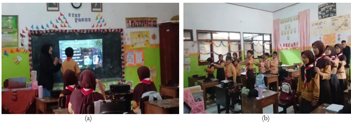
Gambar 4. (a) Pemaparan materi dengan mengikutsertakan peserta didik untuk tampil aktif, (b) Pelaksanaan ice breaking di tengah penyampaian materi

Senam pagi bukan merupakan program kegiatan pengabdian masyarakat, melainkan program yang telah diinisiasikan oleh SD Negeri Dukuh Mencek 04 Jember dengan mengikuti kebijakan pemerintah yang berlaku melalui Kementerian Pendidikan Dasar dan Menengah (Kemendikdasmen). Hal menarik yang ditemukan yaitu ketua kelas 5 SD Negeri Dukuh Mencek 04 Jember selalu menyiapkan kelas melalui doa bersama dan mengucapkan kelima sila Pancasila secara bersama-sama. Hal tersebut menandakan bahwa SD Negeri Dukuh Mencek 04 Jember menjadi stakeholder dalam upaya nyata membangun karakter generasi penerus bangsa yang berlandaskan pada nilai-nilai Pancasila. Membiasakan peserta didik untuk selalu mengingat nilai-nilai dan isi Pancasila sejak usia praremaja. Kedua kegiatan tersebut secara konsisten dilakukan sekolah dan menjadi pembuka kegiatan selama 4 minggu.