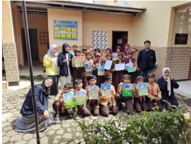
Gambar 11. Foto bersama wali kelas dan peserta didik kelas 5 SD Negeri Dukuh Mencek 04 Jember

Sebelum mengakhiri kegiatan pada minggu ketiga, dilakukan foto bersama sebagai tanda berakhirnya pentas unjuk bakat kelas 5 SD Negeri Dukuh Mencek 04 Jember. Wali kelas juga diajak untuk mengapresiasi bersama semua peserta didik kelas 5 SD Negeri Dukuh Mencek 04 Jember yang dengan percaya dirinya telah menampilkan potensi dan bakat di hadapan teman kelasnya. Pentas unjuk bakat diharapkan dapat menjadi wadah pengembangan bakat mereka beserta peningkatan kepercayaan diri di setiap peserta didik kelas 5 SD Negeri Dukuh Mencek 04 Jember.