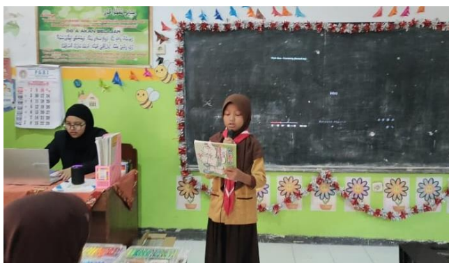
Gambar 9. Menampilkan bidang bakat pembacaan puisi

Pada Gambar 7 dan 8 adalah gambaran kegiatan pada minggu ketiga yaitu pengenalan ecoprint beserta langkah-langkah dalam pembuatannya. Kemudian, dilanjutkan dengan pentas unjuk bakat di dalam kelas sebagai bentuk nyata yang signifikan dari kegiatan pengabdian masyarakat terkait dengan menggali potensi diri bagi peserta didik SD Negeri Dukuh Mencek 04 Jember. Pentas unjuk bakat diikuti dengan antusias yang tinggi oleh peserta didik kelas 5 SD Negeri Dukuh Mencek 04 Jember. Terhitung sebanyak 20 siswa mendaftarkan dirinya ke dalam beberapa bidang bakat yang mereka tekuni, di antaranya bidang mewarnai, menggambar/sketsa, menyanyi, membuat dan membaca puisi. Adapun beberapa dokumentasi di bidang bakat lainnya yaitu: