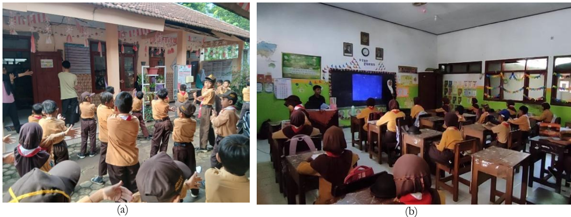
Gambar 3. (a) Senam pagi bersama dengan seluruh peserta didik dan dewan guru SD Negeri Dukuh Mencek 04, (b) Kelas disiapkan oleh ketua kelas dengan membaca doa dan mengucapkan sila Pancasila

Senam pagi bukan merupakan program kegiatan pengabdian masyarakat, melainkan program yang telah diinisiasikan oleh SD Negeri Dukuh Mencek 04 Jember dengan mengikuti kebijakan pemerintah yang berlaku melalui Kementerian Pendidikan Dasar dan Menengah (Kemendikdasmen). Hal menarik yang ditemukan yaitu ketua kelas 5 SD Negeri Dukuh Mencek 04 Jember selalu menyiapkan kelas melalui doa bersama dan mengucapkan kelima sila Pancasila secara bersama-sama. Hal tersebut menandakan bahwa SD Negeri Dukuh Mencek 04 Jember menjadi stakeholder dalam upaya nyata membangun karakter generasi penerus bangsa yang berlandaskan pada nilai-nilai Pancasila. Membiasakan peserta didik untuk selalu mengingat nilai-nilai dan isi Pancasila sejak usia praremaja. Kedua kegiatan tersebut secara konsisten dilakukan sekolah dan menjadi pembuka kegiatan selama 4 minggu.