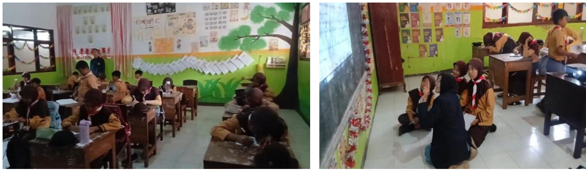
Gambar 5. (a) Peserta didik kelas 5 SD Negeri Dukuh Mencek 04 mengerjakan pre-test , (b) Keaktifan peserta didik kelas 5 untuk memahami soal pre-test