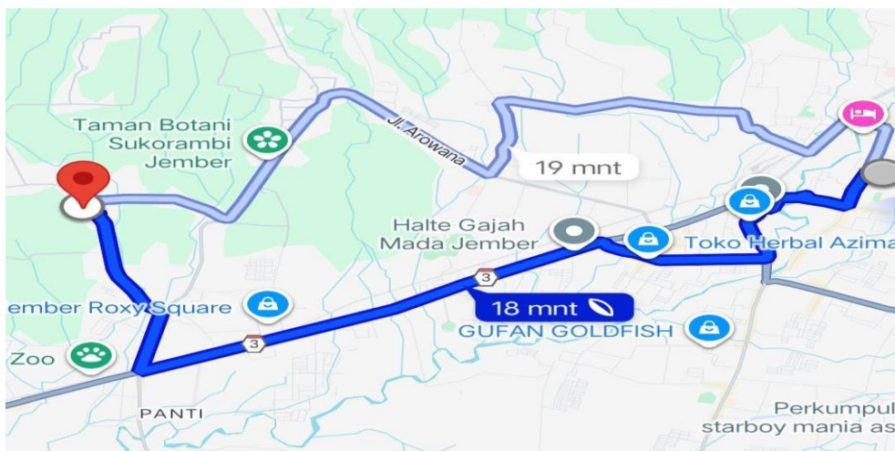
Gambar 2. Peta Lokasi Kegiatan.

Lokasi pengabdian masyarakat adalah SD Negeri Dukuh Mencek 04 yang berlokasi di Dusun Ampo, Dukuh Mencek, Kecamatan Sukorambi, Kabupaten Jember, Jawa Timur. Jarak lokasi dari Universitas Jember sekitar 12 kilometer dengan jarak tempuh 18 menit.