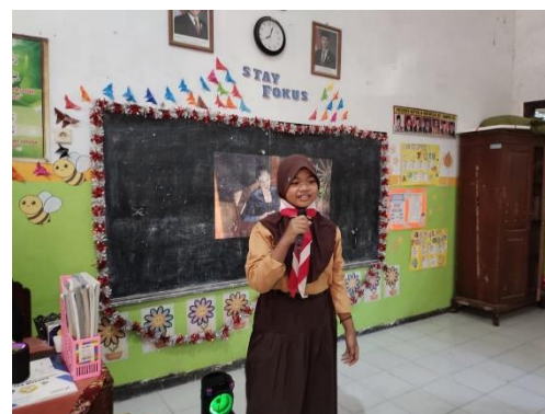
Gambar 10. Menampilkan bidang bakat menyanyi

Pada minggu ketiga difokuskan pada pendalaman karakter peserta didik untuk mereka dapat mengetahui secara mendalam terkait potensi dan bakat dalam diri mereka. Pentas unjuk bakat mendapatkan feedback yang baik dari para peserta didik kelas 5. Mereka mengikuti pentas unjuk bakat dengan penuh energik serta penuh semangat. Hal tersebut tergambar pada saat dilakukan foto bersama dengan para peserta didik beserta wali kelas 5 SD Negeri Dukuh Mencek 04 Jember. Adapun dokumentasi akhir kegiatan pada minggu ketiga yaitu: