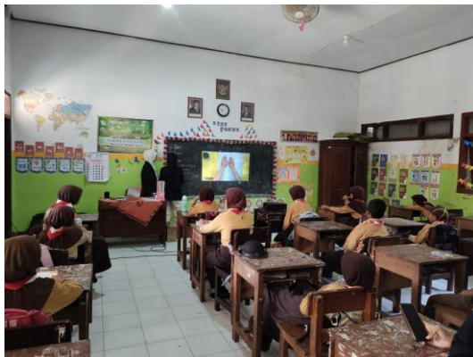
Gambar 7. Menampilkan tutorial ecoprint

pertama. Melalui penyampaian materi juga diselipkan mini games untuk menguji secara mendalam keaktifan mereka dalam memahami perbedaan potensi dan bakat. Gambar 6 (b) merupakan gambaran tahap pemberian penghargaan bagi kelompok yang memiliki poin unggul dalam permainan mini games . Pemberian penghargaan sebagai bentuk apresiasi karena mereka merupakan kelompok yang paling aktif dalam menjawab setiap pertanyaan yang ada. Kemudian, pertemuan pada minggu kedua diakhiri dengan mendata setiap siswa yang secara sukarela akan menunjukkan bakat mereka pada minggu ketiga.