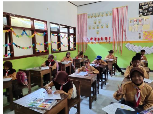
Gambar 8. Memulai pengerjaan bakat bidang mewarnai

Pada Gambar 7 dan 8 adalah gambaran kegiatan pada minggu ketiga yaitu pengenalan ecoprint beserta langkah-langkah dalam pembuatannya. Kemudian, dilanjutkan dengan pentas unjuk bakat di dalam kelas sebagai bentuk nyata yang signifikan dari kegiatan pengabdian masyarakat terkait dengan menggali potensi diri bagi peserta didik SD Negeri Dukuh Mencek 04 Jember. Pentas unjuk bakat diikuti dengan antusias yang tinggi oleh peserta didik kelas 5 SD Negeri Dukuh Mencek 04 Jember. Terhitung sebanyak 20 siswa mendaftarkan dirinya ke dalam beberapa bidang bakat yang mereka tekuni, di antaranya bidang mewarnai, menggambar/sketsa, menyanyi, membuat dan membaca puisi. Adapun beberapa dokumentasi di bidang bakat lainnya yaitu: