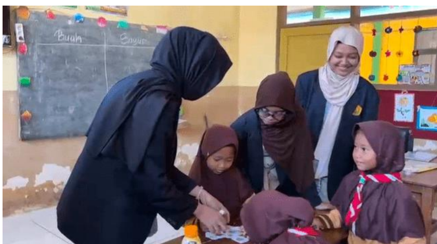
Gambar 3. Permainan edukatif membedakan makanan sehat dan tidak sehat

Pada pertemuan kedua, aktivitas dimulai dengan Senam Anak Indonesia untuk memotivasi siswa dalam proses pembelajaran. Kemudian pretest dilaksanakan untuk menilai pengetahuan awal siswa tentang makanan sehat dan bergizi. Selanjutnya diberikan penjelasan tentang berbagai jenis makanan sehat, keseimbangan gizi, serta efek dari mengonsumsi makanan tidak sehat seperti jajanan pinggir jalan, makanan cepat saji, dan minuman yang mengandung pemanis buatan. Untuk mewujudkan suasana belajar yang menyenangkan, siswa diajak berpartisipasi dalam permainan edukatif dengan cara mengelompokkan gambar buah, sayur, makanan sehat, dan makanan tidak sehat. Pada akhir kegiatan dilaksanakan posttest untuk mengevaluasi pemahaman siswa setelah menerima materi.