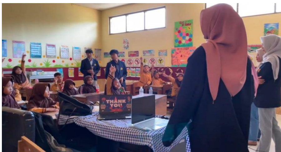
Gambar 2. Penyampaian materi kebersihan diri dan sesi tanya jawab

Kegiatan yang dilaksanakan berupa proses pengajaran berfokus pada pola hidup sehat dan bersih yang ditujukan kepada siswa kelas II SDN Trebungan, Bondowoso. Kegiatan dilakukan dalam tiga sesi dengan pendekatan edukatif dan partisipatif yang sesuai dengan kelompok usia siswa. Pada pertemuan pertama, sebelum sesi belajar dimulai, siswa diajak melakukan ice breaking bersama guna meningkatkan energi dan semangat mereka. Kemudian dilaksanakan pretest untuk mengukur pemahaman awal mereka tentang kebersihan diri, yang mencakup kebiasaan mencuci tangan dengan benar, rutin memotong kuku, mandi dua kali sehari, dan menjaga kebersihan lingkungan sekolah. Setelah penjelasan materi, siswa melakukan praktik langsung tentang enam langkah mencuci tangan dan sesi tanya jawab untuk memperkuat pemahaman terhadap materi yang telah disampaikan.