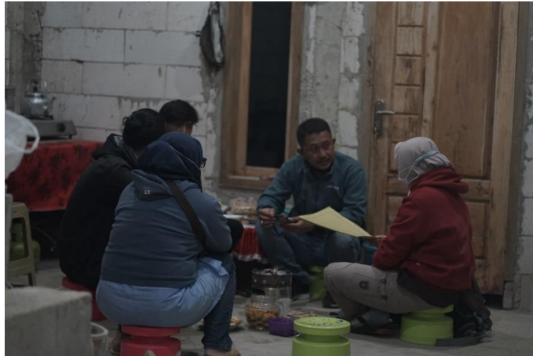
Gambar 1. Diskusi berkaitan dengan konten-konten yang akan diunggah bersama POKDARWIS

Tim pengelola media sosial diberikan pemahaman untuk bisa melakukan sinkronisasi antara media sosial dengan website sehingga website yang telah dibuat dapat berfungsi maksimal. Sehingga, setiap melakukan unggah konten disertakan alamat website untuk memudahkan akses oleh masyarakat dan menaikkan popularitas website. Perkembangan pengetahuan dan teknologi mendorong masyarakat untuk bisa menguasai sistem pemasaran melalui media-media digital [13]. Hal mendasar yang dilakukan oleh tim pengabdian yaitu membiasakan tim pengelola dari Desa Wonokitri untuk menggunakan fitur-fitur yang ada pada aplikasi media sosial serta pendampingan pembuatan konten yang menarik. Langkah selanjutnya yaitu pemahaman atas fungsi media sosial dan website sehingga keduanya dapat digunakan dengan maksimal. Program pendampingan yang dilakukan perlahan merubah pola hidup masyarakat berdasarkan pemahaman atas teknologi informasi khususnya yang ditujukan sebagai sarana promosi wisata [12]. Masyarakat didorong untuk terbiasa menggunakan media sosial untuk proses pencarian informasi.