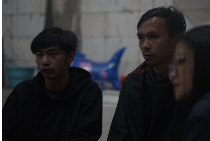
Gambar 2. Perwakilan Pemuda Desa Wonokitri

ranah yang lebih luas berbasis digital [18]. Pemuda desa dianggap lebih banyak memiliki pemahaman terhadap teknologi informasi menjadi modal yang cukup untuk melakukan promosi desa sebagai desa wisata [19]. Hal ini juga untuk mengajarkan dan memberikan pengetahuan kepada pemuda Desa Wonokitri tentang potensi yang dimiliki desa.