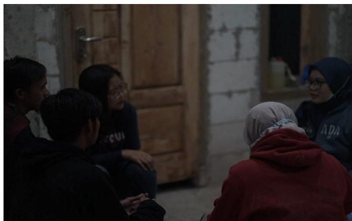
Gambar 3. Pendampingan kepada pemuda Desa Wonokitri

Berdasarkan diskusi awal dengan tim pengelola media sosial Desa Wonokitri, terdapat keterbatasan ide untuk membuat konten yang menarik dan kebingungan untuk menyusun konten yang menarik. Jika diperhatikan memang belum banyak desa yang sadar dengan potensi sumber daya yang dimilikinya sehingga mempengaruhi promosi wisata desa [20]. Potensi Desa Wonokitri yang dapat dimanfaatkan sebagai konten visual berupa gambar dan video berupa keindahan alam Taman Nasional Bromo Tengger Semeru jika wisatawan masuk melalui pintu masuk Desa Wonokitri. Selain itu, taman bunga edelweiss juga dapat dijadikan konten pada media sosial. Wisata alam yang dimiliki Desa Wonokitri dapat dilengkapi dengan wisata budaya setempat termasuk kuliner yang hanya bisa diperoleh wisatawan ketika berkunjung ke Desa Wonokitri. Hal ini perlu menjadi perhatian lebih para pemuda desa yang dilibatkan dalam promosi wisata Desa Wonokitri. Keberadaan pemuda menjadi modal besar yang akan menunjang dan menjamin potensi-potensi yang ada bisa disebar luaskan secara efektif dan efisien [21].