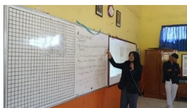
Gambar 2. Kegiatan Sosialisasi 3 Kata Ajaib

Peningkatan skor pre-test ke post-test menunjukkan bahwa media pembelajaran digital berbasis Canva dan metode interaktif efektif dalam meningkatkan pemahaman siswa sekolah dasar. Temuan ini sejalan dengan teori pembelajaran visual yang menyatakan bahwa kombinasi teks, warna, dan ilustrasi memperkuat retensi informasi pada anak usia sekolah dasar. Pembelajaran tematik berbasis media digital menunjukkan adanya peningkatan pemahaman dan perilaku positif siswa. Penggunaan media Canva, permainan edukatif, serta kuis interaktif mendorong motivasi dan partisipasi aktif siswa dalam proses pembelajaran. Hal ini tercermin dari keterlibatan siswa selama kegiatan sosialisasi, seperti pada aktivitas pengenalan tiga kata ajaib (“tolong”, “maaf”, dan “terima kasih”) serta kegiatan ice breaking yang dirancang untuk membangun suasana belajar yang menyenangkan dan interaktif. Dokumentasi kegiatan menunjukkan siswa terlibat aktif dalam diskusi dan permainan edukatif yang mendukung internalisasi nilai-nilai karakter.