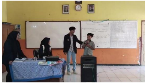
Gambar 3. Kegiatan Ice Breaking

Temuan ini sejalan dengan penelitian sebelumnya yang menyatakan bahwa pemanfaatan teknologi digital dalam pembelajaran dapat meningkatkan keterlibatan siswa dan membantu pemahaman konsep pendidikan karakter secara kontekstual. Kegiatan pengabdian ini memiliki beberapa keterbatasan. Durasi pelaksanaan yang relatif singkat, yaitu satu minggu, belum memungkinkan pengamatan perubahan perilaku siswa dalam jangka panjang. Selain itu, evaluasi perilaku masih bergantung pada hasil observasi guru kelas yang berpotensi menimbulkan subjektivitas. Oleh karena itu, kegiatan serupa di masa mendatang disarankan untuk dilaksanakan dalam jangka waktu yang lebih panjang serta menggunakan metode evaluasi yang lebih objektif guna memastikan keberlanjutan dampak program.