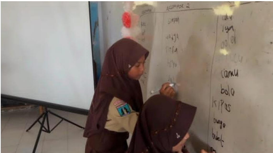
Gambar 4. Kegiatan Menyusun Kata.