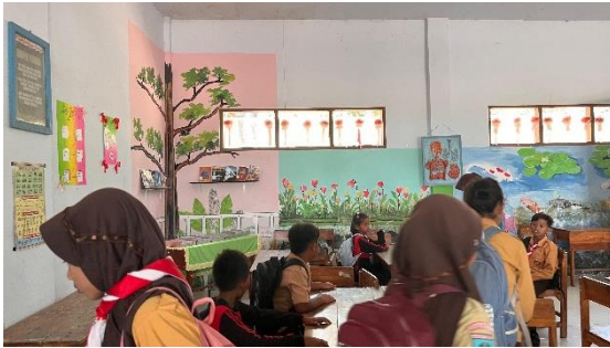
Gambar 2. Kegiatan Pemberian Materi Literasi