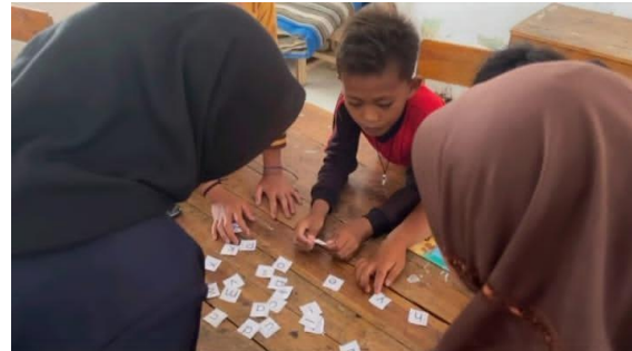
Gambar 3. Kegiatan Menyusun Kata