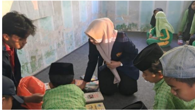
Gambar 2. Pengambilan Buku Cerita

Pada pertemuan kedua, kegiatan difokuskan pada menonton video bertema binatang dan menempelkan gambar hewan yang mencerminkan karakter hasil tontonan. Kegiatan tersebut mendorong siswa untuk berpikir kreatif dan simbolik. Mereka memilih gambar hewan yang merepresentasikan sifat tertentu, seperti singa yang berani atau semut yang rajin, kemudian menjelaskan alasan di balik pilihannya. Guru menilai bahwa kegiatan tersebut mampu menstimulasi daya imajinasi dan mengembangkan kemampuan berpikir analitis siswa. Berdasarkan hasil post-test tambahan yang berfokus pada kemampuan menulis deskriptif, ditemukan adanya peningkatan kemampuan siswa dalam menuliskan ide dan menyusun kalimat yang lebih runtut. Siswa juga menjadi lebih percaya diri ketika diminta menjelaskan hasil karyanya di depan kelas.