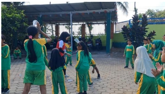
Gambar 4. Kegiatan Solidaritas

Secara keseluruhan, hasil kegiatan menunjukkan bahwa pelaksanaan program literasi di SD Wonosuko 4 berjalan efektif dan terukur. Melalui kombinasi kegiatan membaca, menonton video, berdiskusi, berkarya, dan bermain, siswa tidak hanya mengalami peningkatan kognitif, tetapi juga afektif dan sosial. Berdasarkan analisis hasil pre-test dan post-test , rata-rata nilai siswa meningkat dari 72,5 menjadi 74,5%, mencerminkan peningkatan 2% pada aspek literasi dasar. Selain itu, guru melaporkan adanya perubahan positif dalam perilaku belajar siswa, seperti meningkatnya minat terhadap kegiatan membaca, kemampuan berkomunikasi, serta partisipasi aktif dalam setiap kegiatan.