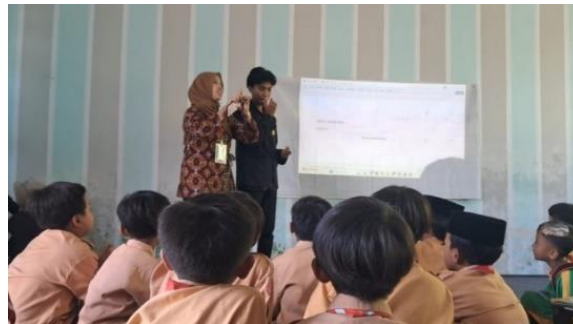
Gambar 3. Presentasi Literasi

Pada pertemuan kedua, kegiatan difokuskan pada menonton video bertema binatang dan menempelkan gambar hewan yang mencerminkan karakter hasil tontonan. Kegiatan tersebut mendorong siswa untuk berpikir kreatif dan simbolik. Mereka memilih gambar hewan yang merepresentasikan sifat tertentu, seperti singa yang berani atau semut yang rajin, kemudian menjelaskan alasan di balik pilihannya. Guru menilai bahwa kegiatan tersebut mampu menstimulasi daya imajinasi dan mengembangkan kemampuan berpikir analitis siswa. Berdasarkan hasil post-test tambahan yang berfokus pada kemampuan menulis deskriptif, ditemukan adanya peningkatan kemampuan siswa dalam menuliskan ide dan menyusun kalimat yang lebih runtut. Siswa juga menjadi lebih percaya diri ketika diminta menjelaskan hasil karyanya di depan kelas.