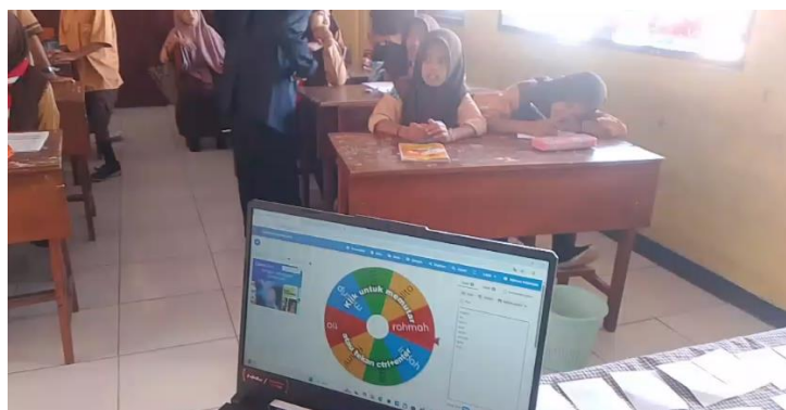
Gambar 2. Siswa belajar nilai-nilai Pancasila dengan metode Truth or Dare