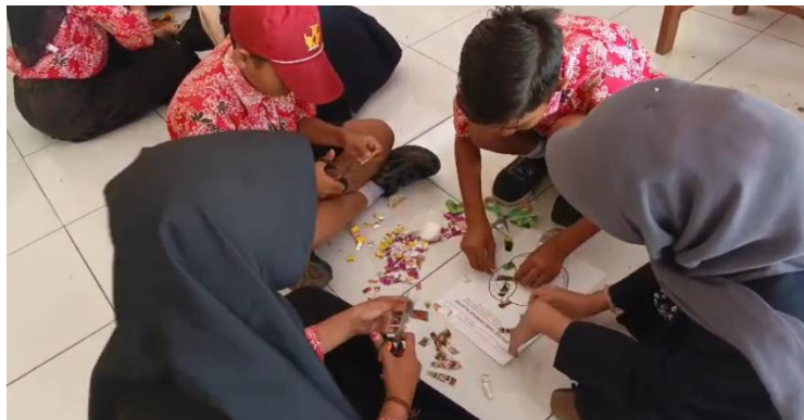
Gambar 3. Siswa sedang membuat karya dari sampah anorganik