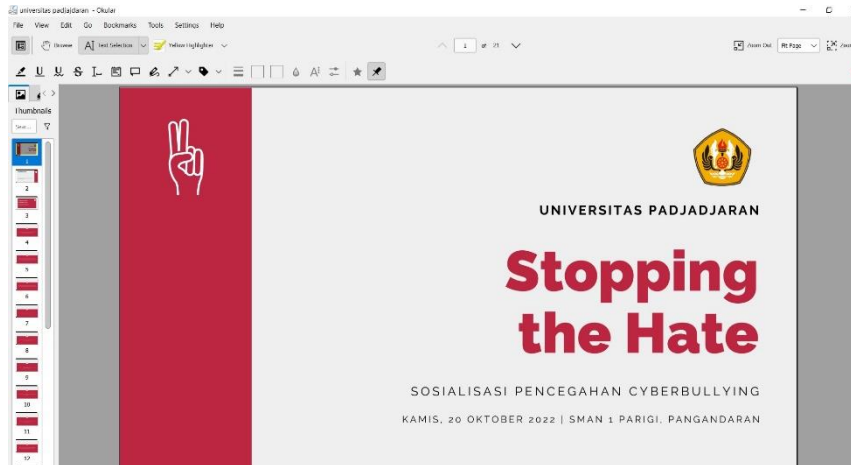
Gambar 2. Halaman Utama Salindia Kegiatan Sosialisasi Pencegahan Perundungan Siber

Materi disampaikan selama kurang lebih 20 menit memberikan contoh-contoh konteks kejadian yang disampaikan oleh siswa/i saat menjawab pertanyaan pemantik. Keterbatasan sarana berupa proyektor di kelas membuat materi berupa salindia tidak dapat ditampilkan. Oleh karena itu materi dikirimkan kepada ketua kelas masing-masing dan disebarakan ke grup kelas agar dapat dipakai sebagai referensi. Waktu 30 menit selanjutnya digunakan untuk sesi tanya jawab. Dari 2 kelas tersebut, terdapat sekitar 8 orang yang mengaku pernah menjadi korban perundungan siber. Setelah sesi tanya jawab, dilanjutkan dengan pengisian post-test selama maksimal 5 menit.