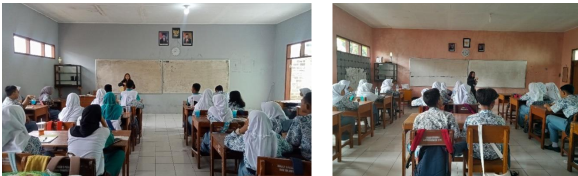
Gambar 3. Sesi pematieran dan diskusi, gambar kiri adalah kelas X IPA 1 dan sebelah kanan adalah kelas X IPA 2.

Materi disampaikan selama kurang lebih 20 menit memberikan contoh-contoh konteks kejadian yang disampaikan oleh siswa/i saat menjawab pertanyaan pemantik. Keterbatasan sarana berupa proyektor di kelas membuat materi berupa salindia tidak dapat ditampilkan. Oleh karena itu materi dikirimkan kepada ketua kelas masing-masing dan disebarakan ke grup kelas agar dapat dipakai sebagai referensi. Waktu 30 menit selanjutnya digunakan untuk sesi tanya jawab. Dari 2 kelas tersebut, terdapat sekitar 8 orang yang mengaku pernah menjadi korban perundungan siber. Setelah sesi tanya jawab, dilanjutkan dengan pengisian post-test selama maksimal 5 menit.