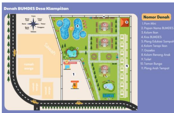
(c) Site Plan BUMDes Desa Klampitan