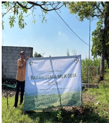
(a) Pemasangan Banner BUMDes Bersama Warga Desa Klampitan