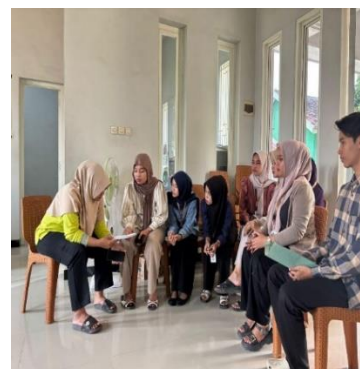
(d) Rembug bersama perangkat Desa Klampitan membahas mengenai Site Plan BUMDes