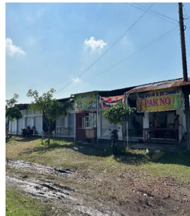
(b) Lokasi BUMDes Desa Klampitan baru di sebelah Pom Mini