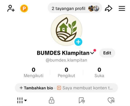
(e) Akun Sosial Media (TikTok) BUMDes Desa Klampitan