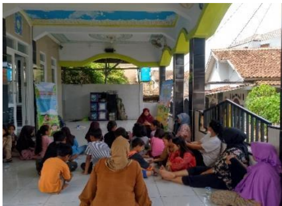
(a) Kegiatan Pemberian Materi