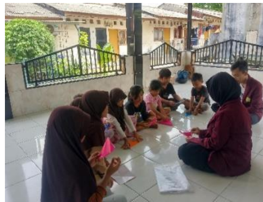
(b) Kegiatan Sehari tanpa Gawai