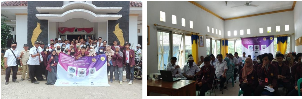
Gambar 3. Dokumentasi Kegiatan Sosialisasi.

Sosialisasi memiliki tujuan guna penyebarluasan atau penanaman nilai-nilai serta norma yang terkandung dalam substansi materi sosialisasi itu sendiri [8]. Begitu pula kegiatan Sosialisasi yang dilakukan oleh Tim Abdimas kepada mitra sasaran Pengabdian. Memiliki tujuan guna mitra sasaran Pengabdian memiliki pemahaman akan hak-hak atas lingkungan hidup yang sehat serta baik serta bagaimana cara mewujudkannya dalam konteks hukum. Dengan mengusung judul “Sosialisasi kebijakan Pengelolaan Lingkungan Hidup dalam Rangka Perlindungan Terhadap Hak-Hak Masyarakat atas Lingkungan Hidup yang Sehat di Desa Kiara kabupaten Karawang”, sosialisasi tersebut dilaksanakan pada tanggal 21 September 2022 di Aula Kantor Desa Kiara.