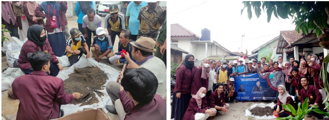
Gambar 4. Dokumentasi Kegiatan Demonstrasi.

bapak-bapak pada wilayah sasaran mitra Pengabdian yang tergabung dalam kelompok tani serta beberapa masyarakat yang memiliki profesi atau berkegiatan langsung dalam pertanian.