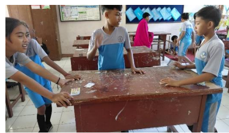
(b) Penerapan kartu kesuma sebagai media pembelajaran