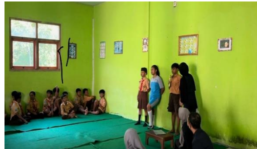
(b) Sosialisasi mengenai pentingnya menjaga kebersihan diri khususnya mencuci tangan