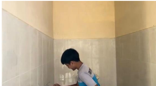
(a) Praktek langsung cara mencuci tangan dengan baik

pada pertemuan kelima dengan penutupan dan pemberian penghargaan kepada siswa yang aktif serta mampu menjawab pertanyaan sebagai bentuk apresiasi guna memotivasi mereka dalam menjalankan pola hidup bersih dan sehat secara berkelanjutan.