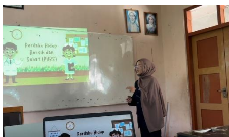
(a) Materi mengenai perilaku hidup bersih dan sehat

Pada hari kedua kegiatan pengabdian, tim melaksanakan pendidikan mengenai pentingnya menjaga kebersihan diri, khususnya kebersihan tangan, sebagai bagian dari praktik Perilaku Hidup Bersih dan Sehat (PHBS). Materi disampaikan melalui media salindia yang memuat penjelasan tentang arti penting menjaga kebersihan tangan, akibat dari tata cara mencuci tangan yang keliru, serta berbagai penyakit yang dapat muncul karena tangan yang kotor, seperti diare, sakit perut, batuk, flu, dan kecacingan. Selain itu, para siswa diberikan pemahaman mengenai waktu-waktu krusial untuk mencuci tangan, di antaranya sebelum makan, sesudah bermain, setelah menggunakan toilet, serta sehabis menyentuh benda yang kotor. Setelah penyampaian materi, kegiatan dilanjutkan dengan peragaan langsung mengenai tata cara mencuci tangan yang benar menggunakan sabun dan air mengalir. Tim menunjukkan setiap tahapan mencuci tangan, mulai dari membasahi tangan, penggunaan sabun, pembersihan telapak tangan, punggung tangan, sela-sela jari, kuku, hingga membilas tangan sampai bersih. Selanjutnya, para siswa diberikan kesempatan untuk melakukan praktik secara langsung berdasarkan tahapan yang telah dicontohkan. Langkah ini dilakukan agar siswa tidak hanya menyerap pengetahuan secara lisan, tetapi juga mampu menjalankan kebiasaan mencuci tangan dengan tepat dalam kehidupan sehari-hari guna menjaga kesehatan diri serta lingkungan sekitar.