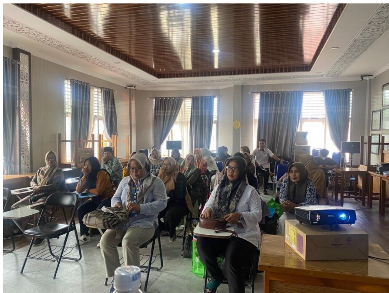
Gambar 4. Kegiatan pendampingan

Setelah disepakati hari pendampingan, kedua dinas memfasilitasi kegiatan berupa penyediaan aula untuk masing – masing pelaku usaha binaan berkumpul. Dinas juga menyediakan konsumsi berupa makanan kecil kotak untuk pelaku usaha dan tim pengabdian. Kegiatan pendampingan diawali dengan pengenalan logo baru halal dari BPJPH, sebagai bentuk sosialisasi terhadap bentuk logo baru (15). Selanjutnya pelaku usaha diberikan kembali materi penguatan urgensi sertifikat halal, mengapa kemudian produk mereka perlu untuk mendapatkan sertifikat halal. Selain itu, pelaku usaha juga diberikan pengetahuan tentang prosedur untuk memasukkan produk mereka ke toko modern seperti swalayan dan mall, salah satunya adalah sertifikat halal.