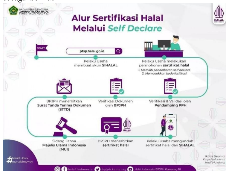
Gambar 2. Alur Sertifikasi Halal Self Declare

Berdasarkan data awal diketahui bahwa mayoritas UMK di Tanjung Jabung Timur belum memiliki sertifikat halal terhadap produk makanan yang mereka jual. Maka dari itu, sosialisasi dan pengarahan sertifikasi halal kepada pelaku usaha makanan maupun minuman di Kabupaten Tanjung Jabung Timur menjadi suatu kegiatan yang dianggap penting untuk dilakukan. Selain itu, ketentuan pemerintah sesuai Undang Undang No.33 tahun 2014 yang mensyaratkan pada tahun 2019 seluruh produk yang dijual di masyarakat wajib memiliki sertifikat halal atau mendapat label halal mengindikasikan perlunya sebuah kajian lebih lanjut mengenai pemahaman sertifikasi halal produk makanan pada UMK di Kabupaten Tanjung Jabung Timur sebagai bentuk perlindungan terhadap konsumen dan implementasi UU Jaminan Produk Halal. Saat ini sertifikat halal bagi pelaku usaha dengan produk non kritis dapat dilakukan dengan mekanisme self declare atau pengakuan mandiri, dengan tahapan sebagai berikut: