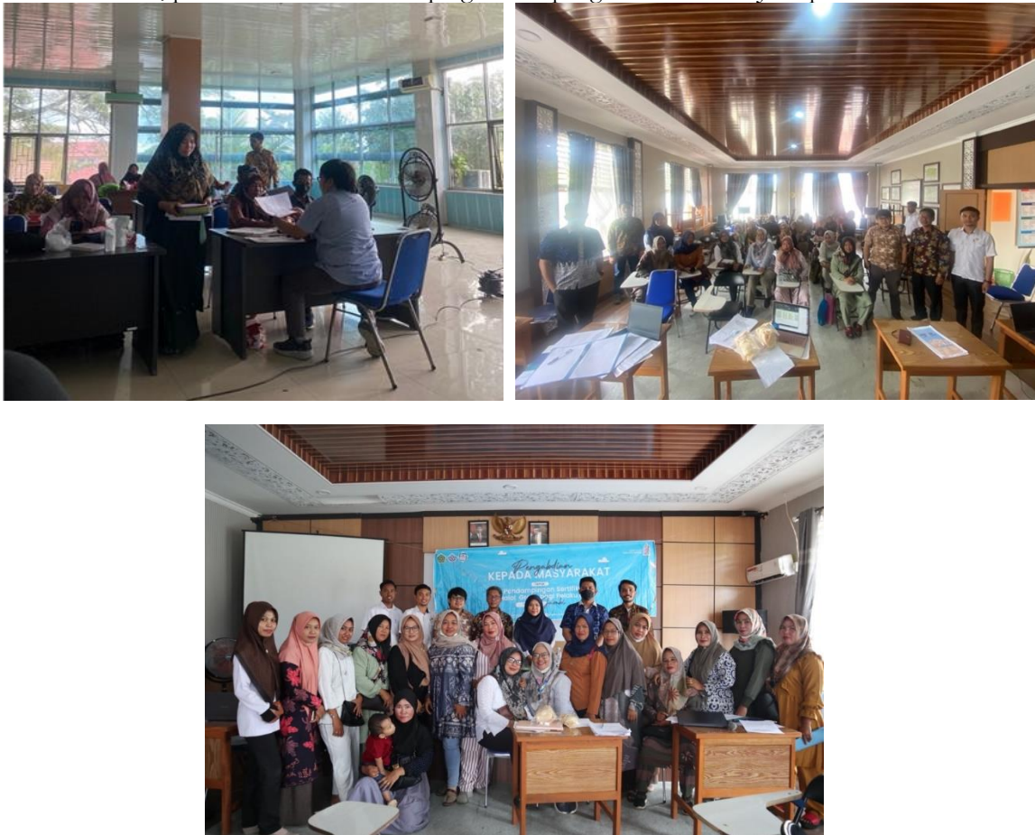
Gambar 5. Dokumentasi Kegiatan pendampingan

Setelah itu, pelaku usaha akan didampingi untuk pengisian formulir SJPH pada akun sihalal.