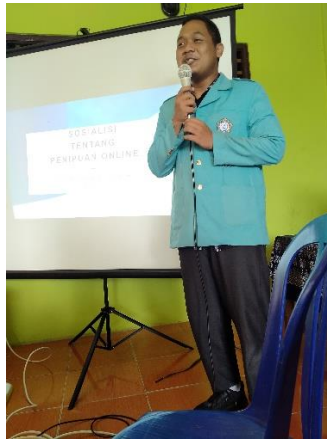
Gambar 2. Dokumentasi mahasiswa KKN Kelompok 8 menyampaikan penyuluhan tentang Penipuan Online

Kegiatan penyuluhan ini diikuti dengan antusias oleh peserta. Selain itu, kegiatan penyuluhan ini mendapat dukungan dari perangkat Desa Bagor, Miri, Sragen karena dapat meningkatkan kewaspadaan masyarakat dalam bersosial media agar terhindar dari segala bentuk penipuan online . Bentuk dukungan lainnya berupa diberikan izin tempat berupa balai desa dan perlengkapan yang digunakan dalam menyampaikan materi. Gambar 3 berikut ini memperlihatkan peserta berupa ibu-ibu PKK yang hadir dalam penyuluhan ini.