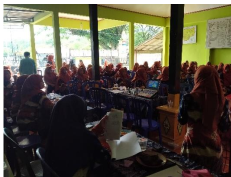
Gambar 3. Dokumentasi peserta penyuluhan berupa ibu-ibu PKK

Kegiatan penyuluhan ini diikuti dengan antusias oleh peserta. Selain itu, kegiatan penyuluhan ini mendapat dukungan dari perangkat Desa Bagor, Miri, Sragen karena dapat meningkatkan kewaspadaan masyarakat dalam bersosial media agar terhindar dari segala bentuk penipuan online . Bentuk dukungan lainnya berupa diberikan izin tempat berupa balai desa dan perlengkapan yang digunakan dalam menyampaikan materi. Gambar 3 berikut ini memperlihatkan peserta berupa ibu-ibu PKK yang hadir dalam penyuluhan ini.