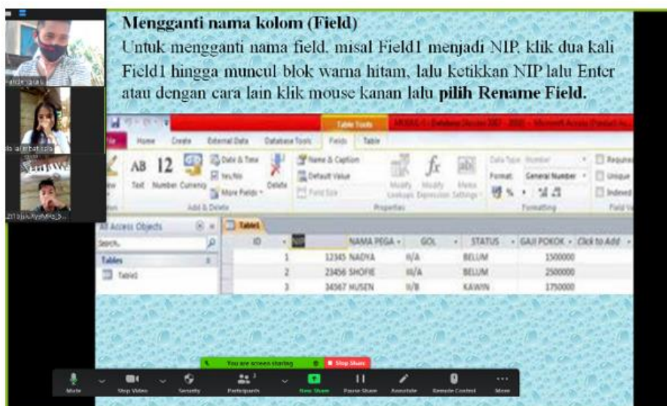
Gambar 5. Sosialisasi Aplikasi Pengelolaan Daftar Hadir Bagi Guru dan Siswa

Pada suatu organisasi satuan pendidikan Sekolah Menengah kejuruan perlu menetapkan manajemen yang tepat [13]. Daftar hadir siswa di SMK Negeri 5 Talaud tujuannya yaitu mengetahui banyak-nya jumlah siswa yang hadir dan yang tidak hadir pada saat pembelajaran di suatu kelas. Pengelolaan daftar hadir di SMK Negeri 5 Talaud bukanlah berdasarkan Standar Operasional Prosedur (SOP) dari kebijakan pemerintah daerah [14], tetapi berdasarkan kebijakan dari guru wali kelas. Pada gambar 5 dapat dijelaskan bahwa pada proses awal dimulai dengan mengimput data siswa dimana yang melakukan input data tersebut yaitu seorang guru yang bertugas sebagai wali kelas, kemudian data siswa selesai di input data tersebut dibuat daftar hadir. Daftar hadir memperlihatkan golongan Guru yang hadir pada mata pelajaran yang sedang diampu nya untuk dilakukan absensi.