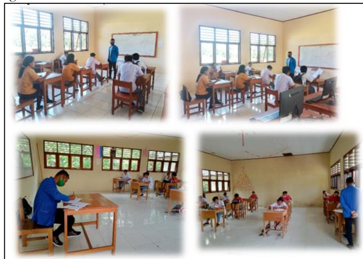
Gambar 2. Dokumentasi Survei Lapangan di SMK Negeri 5 Talaud

SMK Negeri 5 Talaud adalah salah satu sekolah menengah kejuruan yang berstatus negeri yang berdiri pada tahun 2006 dan berlokasi di Desa Batumbalango Kecamatan Essang Selatan Kabupaten Kepulauan Talaud Provinsi Sulawesi Utara. Pada awal berdirinya SMK Negeri 5 Talaud dipimpin oleh Bapak Atnes Unas, S.pd sebagai kepala sekolah pertama yang membawahi 2 orang guru dengan 30 orang siswa.