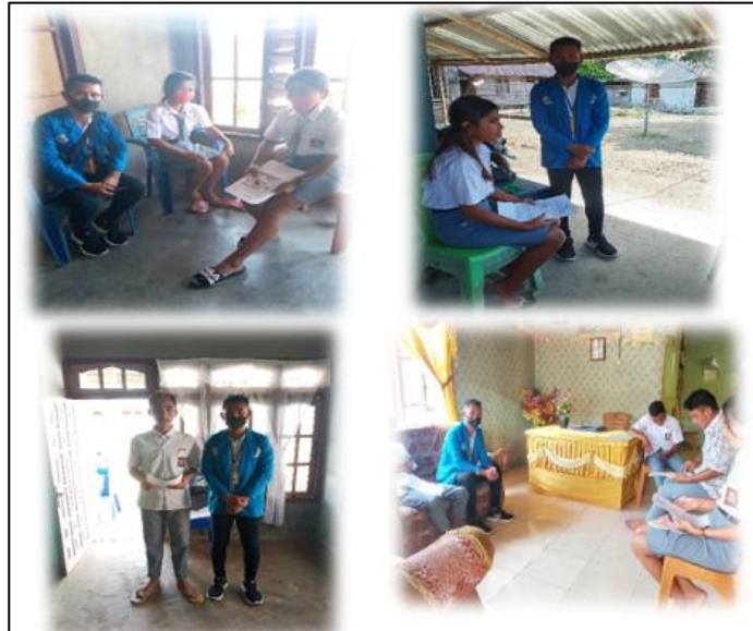
Gambar 3. Sosialisasi Secara Luring dirumah masing-masing pada Siswa SMK Negeri 5 Talaud

SMK Negeri 5 Talaud memiliki 19 (sembilan belas) orang guru yang terdiri dari 13 (tiga belas) orang guru Pegawai Negeri Sipil (PNS), 6 (enam) orang guru Tenaga Harian Lepas (THL), 1 (satu) orang tata usaha dan 1 (satu) orang penjaga sekolah. Tiga belas orang guru tetap terdiri dari 8 (delapan) orang laki-laki dan 5 (lima) orang perempuan, enam orang guru THL terdiri dari 4 (empat) orang laki-laki dan 2 (dua) orang perempuan, dan 1 (satu) orang tata usaha perempuan.