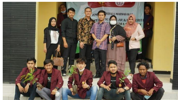
Gambar 4. Dokumentasi Kegiatan

Hasil dari kegiatan ini ialah dimana sasaran mitra Pengabdian dapat memulihkan, memelihara dan meningkatkan kondisi lahan agar dapat berproduksi dan berfungsi secara optimal, baik sebagai pengatur tata air atau pelindung yang terjadi terhadap lingkungan serta menghasilkan pupuk pestisida organik yang jauh lebih murah tetapi memiliki kandungan zat yang sangat baik bagi tanah dan tumbuhan. Melalui kegiatan ini pula, sasaran mitra Pengabdian menyadari pentingnya lahan pertanian serta perlindungan hukum bagi Petani serta dalam rangka mewujudkan ketahanan pangan daerah.