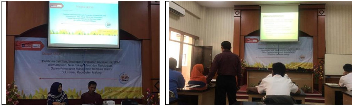
Gambar 2. Dokumentasi Kegiatan.