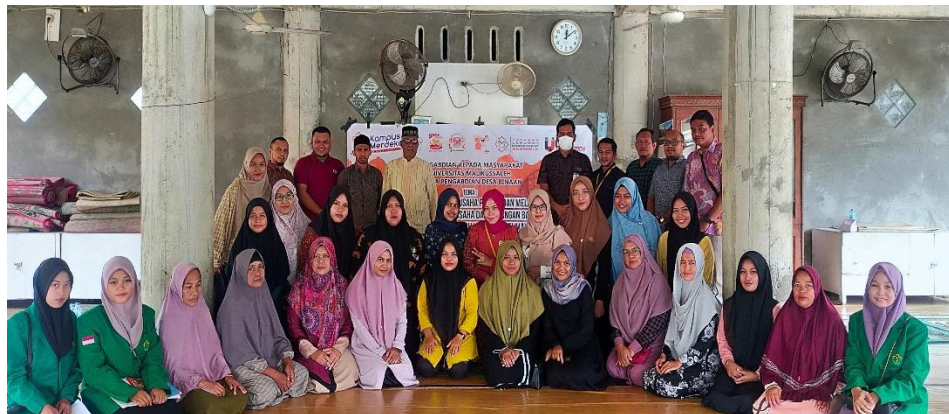
Gambar 4. Dokumentasi Kegiatan Pengabdian

mengenal uang kertas baru dan juga masih ragu dalam menggunakannya khawatir bahwa uang yang diedarkan adalah uang palsu dikarenakan bentuk dan warna yang cenderung berbeda dengan uang lama. Pada sesi ini para masyarakat dapat menerima dengan baik uang baru dan mulai mempergunakannya tanpa ragu, diinformasikan juga bahwa uang lama jangan disimpan terlalu lama karena akan ditarik secara pelan-pelan dari edaran dan akan beralih ke penggunaan uang baru secara menyeluruh.