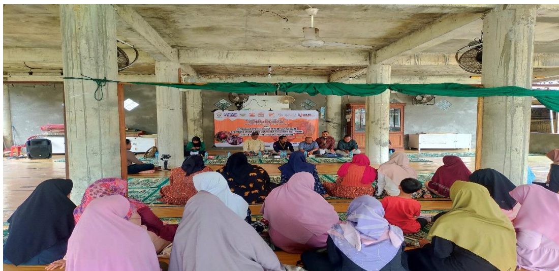
Gambar 3. Kegiatan Sosialisasi

Tahap pertama dilakukan untuk memberikan wawasan dan pendalaman pemahaman yang sangat penting yang harus dimiliki oleh para pelaku usaha UMKM terkait dengan bagaimana motivasi dan kreatif serta bagaimana cara dan strategi berdagang atau berniaga secara online . Pada pelaksanaan kegiatan tahap pertama ini diketahui umumnya para peserta mengerti tentang pemahaman dasar penjualan online dari sisi konsumen, tetapi wawasan mereka sangat minim jika dilihat dari sisi produsen. Dan dari penyampaian materi ini mereka mendapatkan wawasan dan pemahaman secara jelas tentang konsep dan contoh-contoh penjualan yang terarah melalui penjualan online . Sesi berikutnya dilanjutkan dengan penyampaian materi tentang Etika Bisnis Islam dimana para pelaku usaha UMKM masih belum menerapkan etika bisnis Islam secara menyeluruh di dalam bisnis, dalam Islam berbisnis tidak hanya untuk mendapatkan keuntungan didunia saja tapi juga untuk mencari ridha Allah SWT di akhirat, dengan menerapkan etika bisnis Islam dalam setiap proses bisnis, seperti proses produksi, kehalalan produk hingga cara penjualan dan pemasaran yang tidak mengandung kecurangan. Pada sesi ini peserta diharapkan dapat memahami secara menyeluruh dan memiliki kesadaran untuk menerapkan etika bisnis Islam di setiap transaksinya.