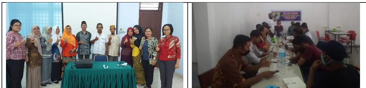
Gambar 2. Hasil Kegiatan

Pelatihan Peningkatan Pengetahuan Pengurus/ Pengelola Koperasi di ikuti oleh 30 peserta dari unsur Pengurus dalam hal Ketua atau Sekretaris Koperasi yang ada dalam wilayah Kabupaten Aceh Timur. Sementara itu Pelatihan diikuti oleh 30 peserta berasal dari Bendahara Koperasi yang ada di Kabupaten Aceh Timur.