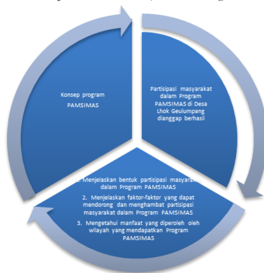
Gambar 1. Tahapan Perencanaan Pengabdian yang dilakukan

Ruang lingkup materi penelitian dibatasi pada penjelasan bentuk-bentuk partisipasi, faktor-faktor yang dapat mendorong dan menghambat partisipasi masyarakat serta manfaat Program PAMSIMAS. Alur pengabdian ini dapat dilihat lebih jelas dalam gambar 1.