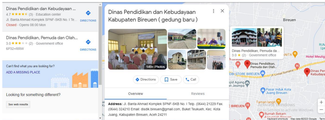
Gambar 1. Map Lokasi Kegiatan