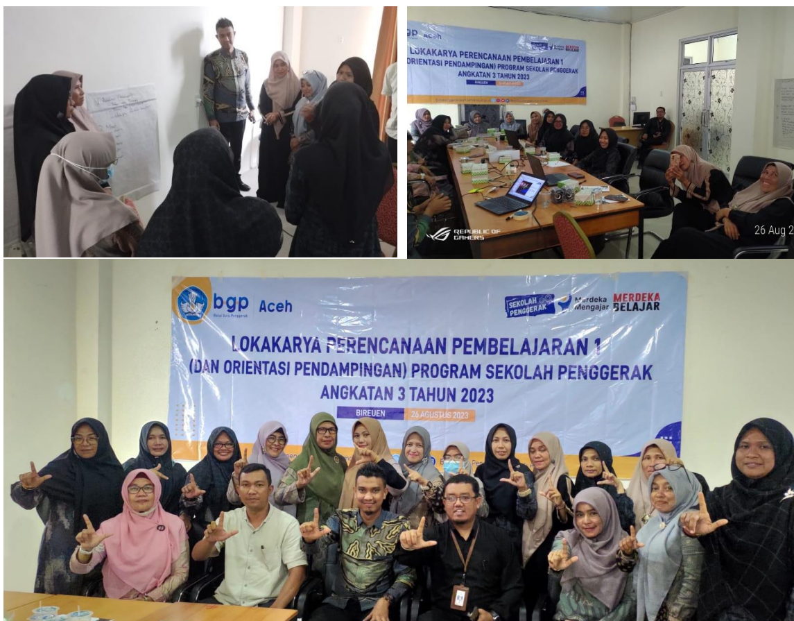
Gambar 4. Dokumentasi Kegiatan Demonstrasi Konstektual, Elaborasi Pemahaman, Koneksi Antar Materi, dan Rencana Aksi Nyata

Salah satu dampak konkret yang terlihat adalah pengembangan materi pelajaran yang lebih relevan dengan minat dan kebutuhan siswa. Guru-guru dan tenaga pendidik mulai merancang materi pembelajaran yang lebih menarik dan sesuai dengan karakteristik siswa mereka. Mereka belajar bagaimana mengidentifikasi minat dan kebutuhan individu siswa, yang memungkinkan mereka untuk menciptakan materi pembelajaran yang lebih bermakna. Hasilnya adalah pengalaman pembelajaran yang lebih khusus dan relevan bagi siswa, yang secara langsung mendukung perkembangan mereka dalam proses pendidikan.