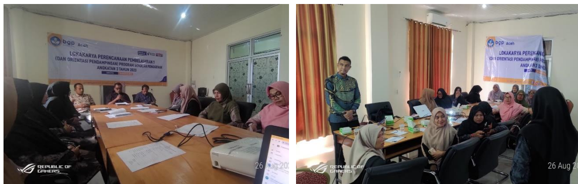
Gambar 2. Kegiatan Pembukaan dan Ice Breaking

Pelaksanaan Lokakarya Pendekatan Berpusat pada Siswa di Kabupaten Bireuen telah menghasilkan serangkaian dampak positif yang signifikan dalam dunia pendidikan. Dalam upaya peningkatan mutu pendidikan di Kabupaten Bireuen, terutama di lingkup Sekolah Penggerak Angkatan 3, program ini telah membawa perubahan yang cukup berarti.