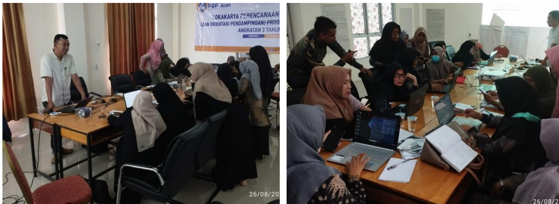
Gambar 3. Kegiatan Eksplorasi konsep dan Ruang Kolaborasi

Salah satu dampak konkret yang terlihat adalah pengembangan materi pelajaran yang lebih relevan dengan minat dan kebutuhan siswa. Guru-guru dan tenaga pendidik mulai merancang materi pembelajaran yang lebih menarik dan sesuai dengan karakteristik siswa mereka. Mereka belajar bagaimana mengidentifikasi minat dan kebutuhan individu siswa, yang memungkinkan mereka untuk menciptakan materi pembelajaran yang lebih bermakna. Hasilnya adalah pengalaman pembelajaran yang lebih khusus dan relevan bagi siswa, yang secara langsung mendukung perkembangan mereka dalam proses pendidikan.