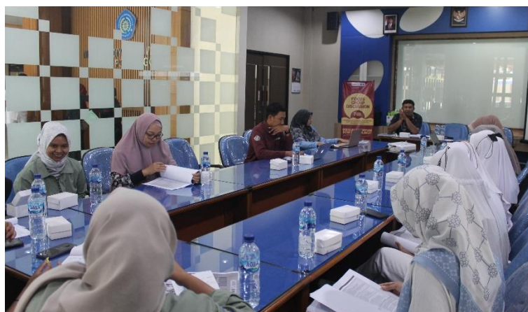
Gambar 4. Diskusi pada Pelaksanaan FGD

Banyak masukan yang diberikan oleh pakar dalam rangka mengkritisi modul yang telah tim selesaikan sebelumnya, sehingga modul yang dibuat tersebut nantinya akan baik dan sesuai ketika diimplementasikan pada sekolah perempuan di Desa Lembah. Pemerintah desa juga banyak memberikan masukan terutama dengan penyesuaian materi dan kondisi anak yang ada di Desa Lembah sehingga materi yang diberikan nantinya dapat diterima dengan baik oleh anak-anak. Pelaksanaan FGD dapat dilihat pada gambar 4 dan 5.