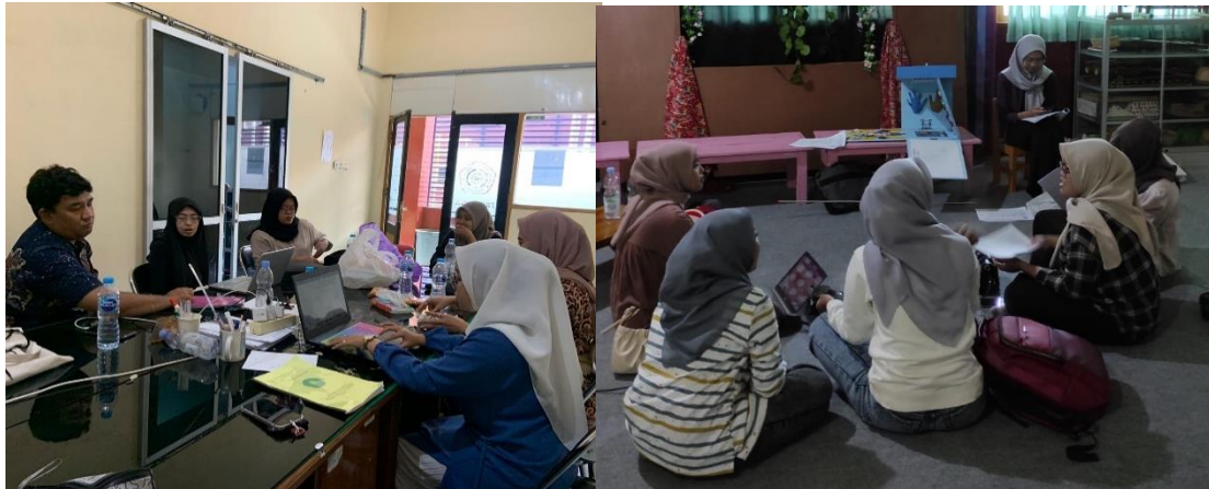
Gambar 2. Koordinasi Persiapan Pelaksanaan FGD

Inggris, dan Pendidikan Guru PAUD, oleh karenanya mereka mempunyai keahlian masing-masing dalam menterjemahkan sumber-sumber materi yang didapatkan. Dalam proses penyusunannya sumber utama dalam penyusunan materi adalah beberapa buku yang diterbitkan oleh UNESCO yaitu International Technical Guidance On Sexuality Education: An Evidence-Informed Approach , School-based Relationships and Sexuality Education (RSE): Lesson for Policy and Practice , dan Relationship and Sex Education: The Evidence . Adapun modul yang telah dibuat berisi lima tema yaitu: (1) Relationship, (2) Organ Reproduksi dan Perkembangannya, (3) Seksualitas dan Kesehatan Reproduksi, (4) Nilai, Hak, Budaya, dan Seksualitas, (5) Kekerasan dan Pencegahan. Adapun proses pembuatan modul ajar dapat dilihat dalam gambar 2 dan modul ajar yang selesai disusun seperti pada gambar 3.