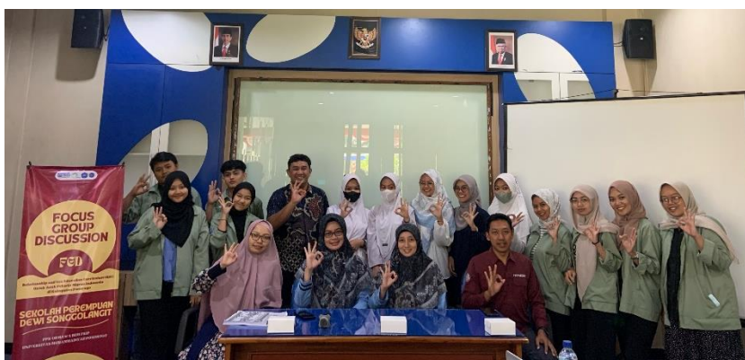
Gambar 5. Foto bersama kegiatan FGD